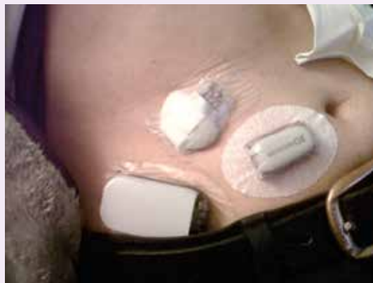
Obr. 1 | Rôzne typy senzorov s externou časťou senzora na povrchu tela.

Súčasne na základe matematického modelovania sa zobrazujú trendové šípky vzostupu, resp. poklesu glykémii. Softwary poskytujú možnosť prednastaviť hodnotu glykémie, pri ktorej pacienta upozorní zvukový alebo vibračný alarm na hroziacu hypoglykémii (prediktívny alarm) a v prípade inzulínovej pumpy spojenej so sensorom (SAP) dokážu na prechodnú dobu zastaviť dávkovanie inzulínu a zabrániť vzniku hypoglykémie (obr. 2). Alarmy môžu byť nastavené aj na aktuálnu hodnotu glykémie, ktorú si navolíme ako hodnotu pre hypo/resp. hyperglykémie. Systémy na monitorovanie glykémie v reálnom čase sú ako samostatné glykemické holtre Dexcom G4 a G5, Guardian Connect