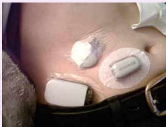
Obr. 1 | Rôzne typy senzorov s externou časťou senzora na povrchu tela.

Súčasne na základe matematického modelovania sa zobrazujú trendové šípky vzostupu, resp. poklesu glykémii. Softwary poskytujú možnosť prednastaviť hodnotu glykémie, pri ktorej pacienta upozorní zvukový alebo vibračný alarm na hroziacu hypoglykémii (prediktívny alarm) a v prípade inzulínovej pumpy spojenej so sensorom (SAP) dokážu na prechodnú dobu zastaviť dávkovanie inzulínu a zabrániť vzniku hypoglykémie (obr. 2). Alarmy môžu byť nastavené aj na aktuálnu hodnotu glykémie, ktorú si navolíme ako hodnotu pre hypo/resp. hyperglykémie. Systémy na monitorovanie glykémie v reálnom čase sú ako samostatné glykemické holtre Dexcom G4 a G5, Guardian Connect