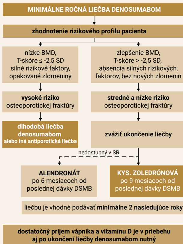
Schéma | Algoritmus liečby denosumabom

Prínos liečby je aj u pacientiek s osteoporózou a vysokým rizikom karcinómu prsníka. Liečba nie je vhodná u pacientiek s klimakterickým syndrómom a s rizikom tromboembolizmu. Dávkovanie, spôsob podania a kon-