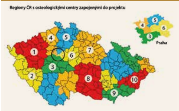
Obr. | Regiony ČR s osteologickými centry spolupracujícími na projektu