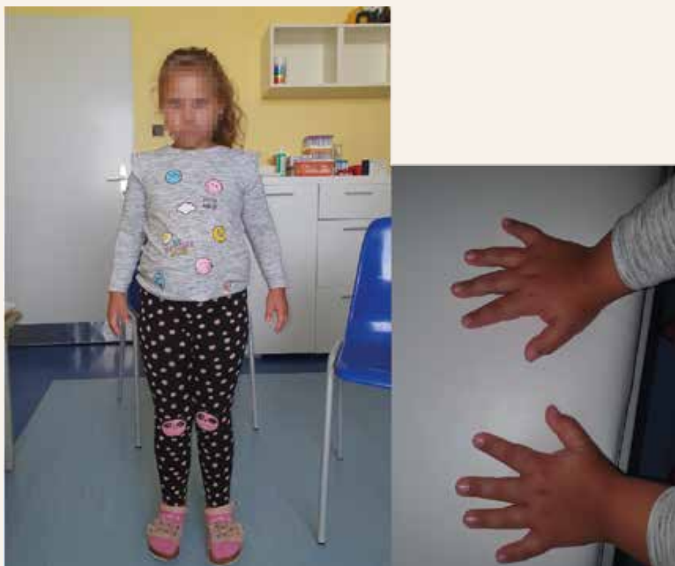
Obr. 1 | Klinické znaky 8-ročnej probandky: hyperlordóza, prominujúce brucho, lordotická chôdza, mierna dysmorfia tváre, diskkrétne širší koreň nosa, výrazné čelo, nízko posadené uši, hypertelorizmus, epikanty, klinodaktýlia, genua valga, krátke prsty

8-ročné dievčatko (obr. 1) je sledované od 16. mesiaca života v endokrinologickej ambulancii Detskej kliniky LF UK a NÚDCH pre intrauterinnú rastovú retardáciu. Narodila sa v 37. týždni tehotenstva nekonsangvinným rodičom. Tehotenstvo bolo predčasne ukončené kvôli nízkemu prietoku krvi placentou, jej pôrodná hmotnosť bola 2 130 g, pôrodná dĺžka 46 cm ( \geq -2SD ) zodpovedajúca gestačnému veku [14]. Peri- a postnatálny priebeh bol bez komplikácií, psychomotorický vývoj primeraný. Rastová krivka sa udržiavala na 3. percen-