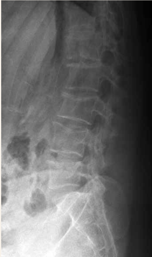
Obr. 1 | RTG LS páteře pacientky s prořídou strukturou obratlových těl

Pacientka užívala od počátku gravidity substituční léčbu pro hypotyreózu a byla sledována pro gestační diabetes mellitus, který byl léčen dietetickými opatřeními. Na jiné chronické onemocnění se neléčila. V rodinné anamnéze byla zjištěna osteoporóza u babičky, u rodičů ani sourozenců se osteoporóza ani patologické fraktury nevyskytly, gynekologická anamnéza byla bez pozoruhodností. Pacientka přouštěla kouření 1 až 2 cigaret denně, alkohol nepila, její fyzická aktivita byla spíše podprůměrná. Komplexním vyšetřením nebyla u pacientky potvrzena ani hormonální porucha ani malabsorpční syndrom, tyreopatie nebo jiná sekundární etiologie osteoporózy. Z laboratorních nálezů byla přítomna pouze hypovitaminóza D (48,3 nmol/l), ostatní hodnoty (krevní obraz, zánětlivé parametry včetně sedimentace erytrocytů, mineralogram, kostní markery, hormonální profil, elektroforéza séra, imunologické vyšetření, acidobazická rovnováha) byly ve fyziologických mezích. Na celotělové scintigrafii skeletu nebyla zjištěna patologická distribuce radiofarmaka. Vyšetření klinickým genetikem včetně podrobného genealogického rozboru vyloučilo onemocnění osteogenesis imperfecta typu I, DNA-analýza nebyla indikována.