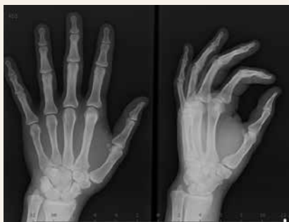
Obr. 2.2 | Cystické projasnění v oblasti hlavíčky 2. metakarpu vlevo po 2 letech vymizelo