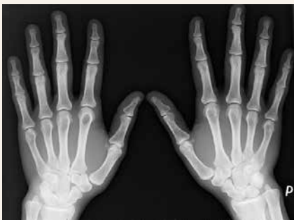
Obr. 2.2 | Cystické projasnění v oblasti hlavíčky 2. metakarpu vlevo po 2 letech vymizelo