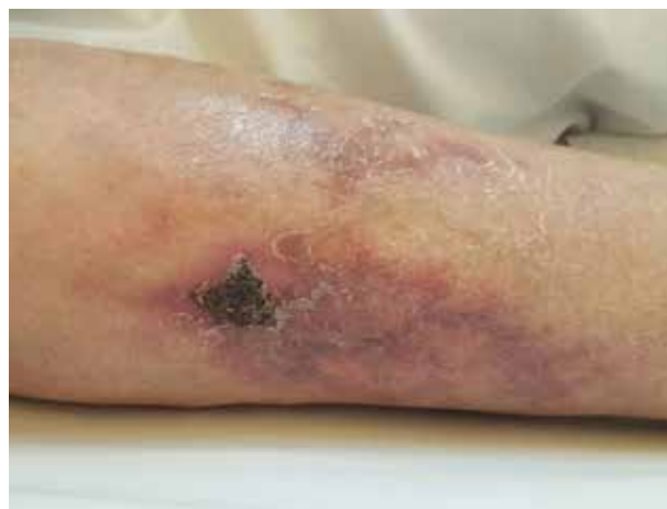
Obr. 8. Kalcifylaxe, livedo racemosum s krustou kryjící nekrotický defekt