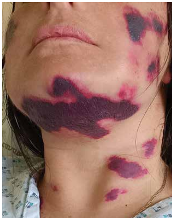
Obř. 1. Hemoragické a nekrotické projevy na krku a v obličeji u pacientky s paroxysmální noční hemoglobinurií

Paroxysmální noční hemoglobinurie (PNH) je vzácná porucha hematopoetických kmenových buněk, která