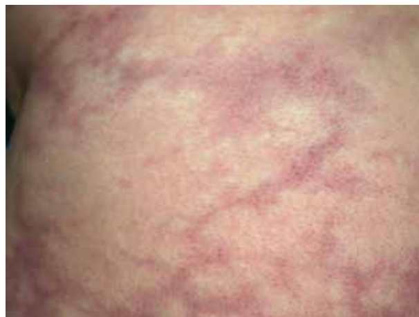
Obr. 5. Příklad projevů typu livedo reticularis