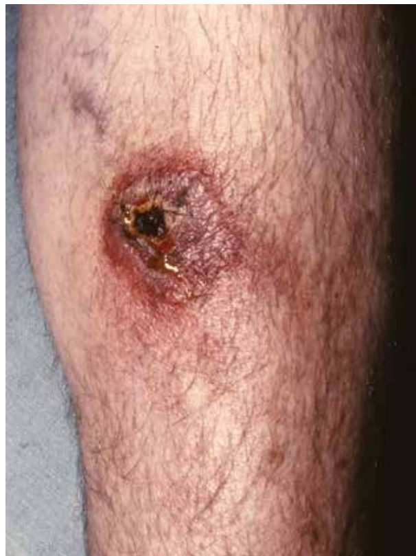
Obr. 4. Ecthyma gangrenosum, ostře ohraničený nekrotický defekt s hemoragickou krustou a okolní jemnou purpurou

Tyto syndromy sdílejí rysy invaze různorodých organismů v cévní stěně. Obvykle se vyskytují u těžce imunokompromitovaných pacientů s těžkou neutropenií a/nebo lékově navozenou imunosupresí. Ecthyma gangrenosum je syndrom okluze organismy (obvykle bakteriálními) proliferujícími v adventicii podkožních cév. Typickou bakterií je Pseudomonas aeruginosa , ale kožní léze podobné ecthyma gangrenosum byly popsány i u jiných bakterií, včetně jiných Pseudomonas spp. ( P. cepacia , P. maltophilia ), Serratia marcescens , Aeromonas hydrophila , Klebsiella pneumoniae , Vibrio vulnificus , Moraxella spp. , Morganella morganii , Escherichia coli a Staphylococcus aureus . Ecthyma gangrenosum mohou vyvolávat i houbové infekce, např. Candida albicans , Mucor spp. , Aspergillus fumigatus , Fusarium spp. a Neoscytalidium dimidiatum [43]. Ecthyma gangrenosum začíná jako erytematózní, nebolestivá makula, typicky progredující do purpury nebo escharotických a nekrotických lézí (obr. 4), které mohou být bulózní nebo pustulózní a často vykazují retiformní rysy. Dochází k rozsáhlé bakteriální infiltraci tunica media, následně i adventicie a perivaskulárního prostoru okolí cévy. Výsledným procesem je stlačení cévní stěny se zúžením lumen přívodné dermální či subkutánní arterioly. Okamžitá antibiotická terapie je zásadní, ale většinou