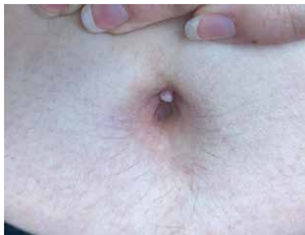
Obr. 1. Klinický obraz

si na dyspareunii. Asi pět let užívala hormonální antikoncepci, nicméně po jejím vysazení si začala stěžovat na bolestivou menstruaci. Při klinickém vyšetření v kožní ambulanci byl zjištěn tuhý, exofyticky rostoucí nodule velikosti asi 10 x 10 mm v oblasti umbiliku, který se jevil palpačně tuhý, měl lehce nafialovělou barvu, ale nekrvácel (obr. 1). Pacientce byl na naše doporučení následně tento útvar excido-