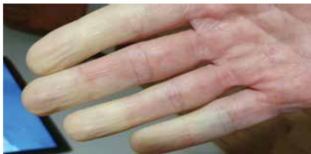
Obr. 1. Primární Raynaudův fenomén u mladé astenické ženy

Nejtypičtější manifestací RF je náhlá změna barvy aker . Nemusí být vždy a u všech nemocných vyjádřen