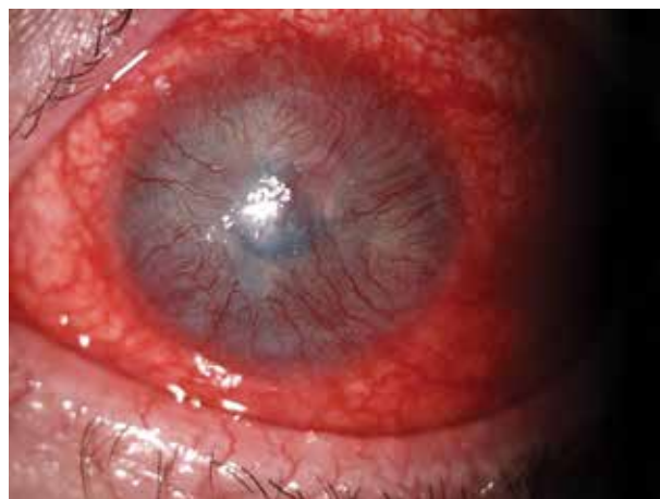
Obr. 5. Aktivní vaskularizace rohovky (konkrétně obr. 4)