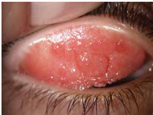
Obr. 4. Gigantopapilární reakce na horních tarzálních spojivkách při atopické keratokonjunktivitidě (konkrétně obr. 3) (fotoarchiv Centra pro onemocnění spojivky a rohovky Oční kliniky 1. LF UK a VFN v Praze)

Objektivně jsou víčka ztluštělá, zarudlá, intermitentně se objevují otoky. Později se objevuje deskvamace, lichenifikace, melanóza. Spojivky vykazují hyperemii, později i hypertrofii papil (obr. 4). Keratitida může progredovat až do vředu. Hojení je často provázeno jizvením a vaskularizací rohovky (obr. 5), což vede k trvalému poklesu zrakové ostrosti. Subjektivně postižení