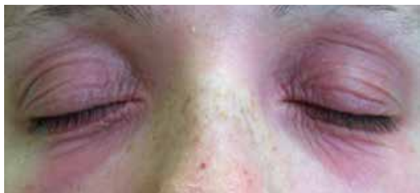
Obr. 1. Atopická dermatitida očních víček a obličeje

V Německu byly v letech 1999–2004 nejčastějším zdrojem relevantních kontaktních alergenů u ekzémů očních víček obličejové krémy, oční stíny, oční kapky a léky (31 %). Nejčastějšími ostatními alergeny s pozitivní reakcí pak byly vonné látky (parfémy mix I a Peru balzám), konzervancia (thiomersal) a léky (neomycin