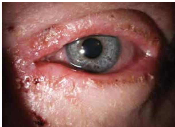
Obr. 2. Těžká atopická blefaritida a ekzém víček

Četnost jednotlivých chorob očního povrchu („ocular surface diseases“) u AD zachycuje recentní dánská studie (2000–2019, 7044 dospělých): dominovala konjunktivitida v 66,6 % a hordeolum v 63,5 %, pak blefaritida a keratitida (11 % a 9,7 %), dále pterygium, symblepharon a keratokonus. Výskyt konjunktivitid u AD byl vyšší u pacientů: s vyšší závažností AD anebo se současným bronchiálním astmatem a alergickou rinitidou a také u pacientů s AD vzniklou v časném dětství anebo léčených systémovou terapií pro AD [22]. Nárůst očního postižení se závažností AD potvrdila i jiná dánská studie (v roce 2017 hodnotila 5766 pacientů s mírnou a 4272 s těžkou AD). Riziko konjunktivitidy bylo 1,5krát vyšší u mírné AD a téměř 2krát vyšší u těžké AD než u běžné populace. Riziko vzniku keratitidy pak bylo téměř 1,5krát vyšší u mírné AD a 3krát vyšší u těžké AD.