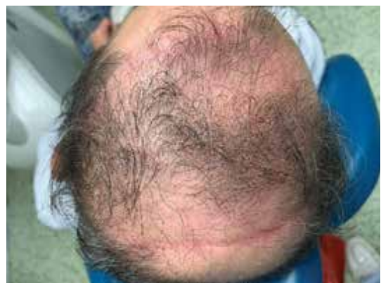
Obr. 9. Zachovaný vlasový kryt