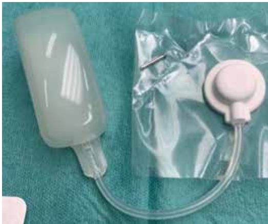
Obr. 5. Tkáňový expandér