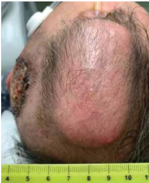
Obr. 6. Tkáňový expandér s portem zevně