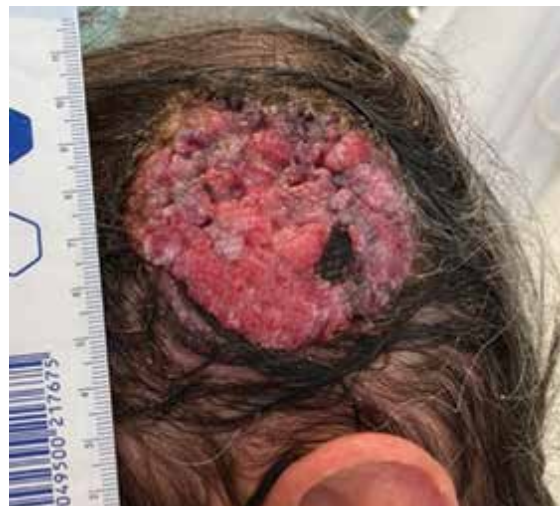
Obr. 1. Tumor parietotemporální oblasti

Při přípravě výkonu jsme z CT vyšetření lebky pacienta zhotovili počítačový 3D model oblasti (obr. 2)