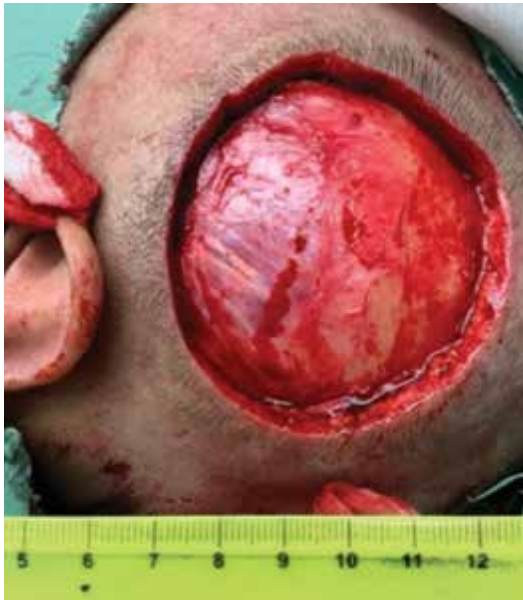
Obr. 4. Po excizi tumoru