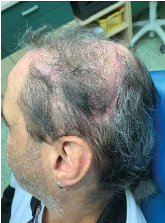
Obr. 10. Tři měsíce po plastice

a následně jeho 3D tisk (obr. 3). Excidovali jsme tumor v rozsahu 6 x 7 cm (obr. 4). Díky 3D modelu jsme mohli vybrat nejvhodnější tkáňový expandér (obr. 5). Všechny výkony jsme prováděli ambulantně v lokální anestezii 4% Supracainem pod clonou ATB (Augmentin 625 mg, tbl. I po 8 hod.). Excize tumoru a implantace expandéru byla provedena současně. Na defekt v kožním krytu byl po celou dobu přípravy laloku aplikován COM 30 (VUP Medical, a. s.) bez nutnosti jeho výměny. Port expandéru byl ponechán zevně, nezaváděli jsme jej subkutánně (obr. 6). Žádné drény jsme při výkonu nepoužili. Expandér jsme již primárně plánovali umístit do větší vzdálenosti od vzniklého defektu. Definitivní histologie potvrdila nález nodulárního bazaliomu s negativními okraji. Plnění expandéru probíhalo ambulantně 8 týdnů při instilaci cca 6 ml fyziologického roztoku 1krát týdně do maximálního objemu 50 ml. Po dosažení potřebné velikosti jsme odstranili expandér (obr. 7) a defekt zakryli vzniklým lalokem. Po okraji sutury byly vyvedeny kapilárními drény (obr. 8). Estetický výsledek 3 měsíce od výkonu je víc než uspokojivý (obr. 9, 10).