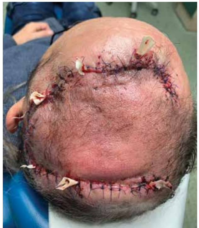
Obr. 8. Plastika defektu