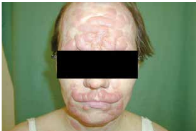
Obr. 6. MF – tumorózní stadium, facies leontina

ných na vlasové folikuly. Typickým znakem je akumulace mucinu ve vlasových folikulech, která však nemusí být patognomonická pro toto onemocnění. Prognóza je horší než u klasické MF, 5 let přežívá 70–80 % pacientů [8]. Léčebně je nutné volit razantnější metody než u konvenční MF, protože infiltrát je lokalizován hlouběji. Pagetoidní retikulóza (Woringerova-Koloppova) je lokalizovaná forma CTCL. Klinicky se manifestuje jako psoriaziformní nebo hyperkeratotické ložisko s typickou lokalizací na končetinách a pomalou progresí choroby. Na rozdíl od klasické MF nedochází u této varianty k mimokožnímu šíření onemocnění. Granulomatózní syndrom ochablé kůže (granulomatous slack skin – GSS) je vzácný podtyp MF charakterizovaný rozsáhlými ložisky, se ztenčelou ochablou kůží vytvářející převislé řasy s predilekcí v axilách a tříselech. U pacientů s GSS se může souběžně manifestovat Hodgkinova choroba [13]. Mezi méně časté klinické obrazy MF řadíme hypopigmentovaná či hyperpigmentovaná ložiska anebo ložiska poikilodermická – poikiloderma atrophicum vasculare (skvrnitá pigmentace, epidermální atrofie a teleangiektazie). Hypopigmentovaná ložiska jsou častější u dětí a u pacientů s tmavší kůží. Vzácně se také můžeme setkat s bulózními/vezikulózními lézemi (plihé nebo napjaté puchýře), purpurovými lézemi, ichtyosiformními projevy, facies leontina (obr. 6).