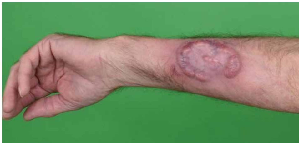
Obr. 3. MF – tumorózní stadium

Mycosis fungoides se kromě klasické formy může projevovat vzácnějšími variantami. Folikulotropní mycosis fungoides (FMF, folikulární mucinóza) představuje asi 10 % všech MF. Postihuje převážně dospělé jedince, spíše muže. Predilekční lokalizace je oblast hlavy a krku, ale vyskytuje se i na ostatních částech těla. Projevuje se