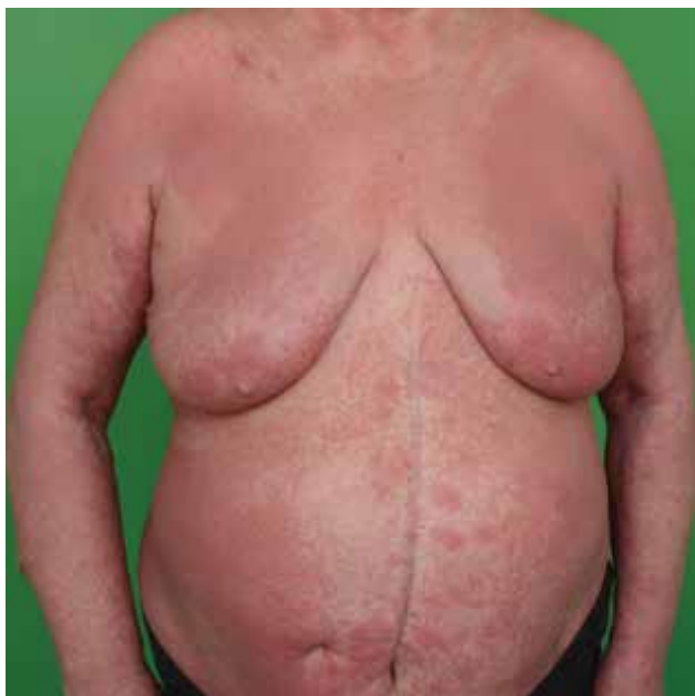
Obr. 4. MF – erythrodermie

erytematozními folikulárně vázanými papulami, akneiformními lézemi, indurovanými plaky a někdy i tumory (obr. 5). V oblasti kapilicia a očních řas vede k alopecii. Folikulotropní MF se histologicky vyznačuje charakteristickými infiltráty z neoplastických T lymfocytů váza-