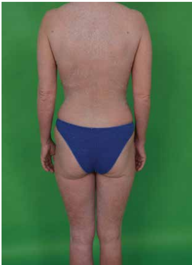
Obr. 7. Sézaryho syndrom

zivně svědí (obr. 7). Přítomná bývá alopecie, ektropion, onychodystrofie, hyperkeratózy dlaní a plosek s tvorbou ragád. V pokročilém stadiu mohou být postiženy vnitřní orgány, nejčastěji játra a slezina, nádorové buňky se však mohou šířit do jakéhokoliv orgánu, včetně kostní dřeně.