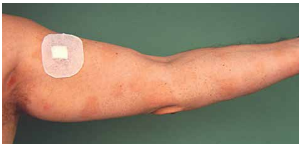
Obr. 1. MF – stadium makul (skvrn)