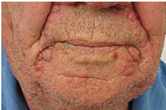
Obr. 5. MF – folikulotropní varianta