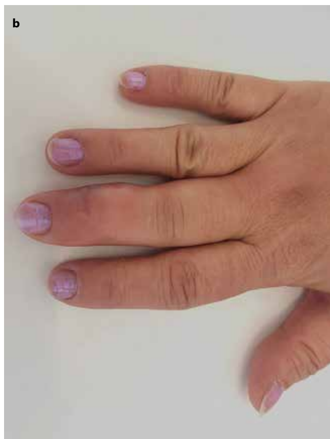
Obr. 1a,b. Vstupní vyšetření: a) pustuly, b) otok III. prstu pravé ruky