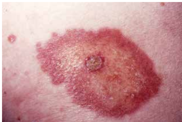
Obr. 1. Necrobiosis lipoidica s počínající ulcerací

Rodinný výskyt NL je vzácný. HLA asociace nebyla prokázána a nebyly prokázány rozdíly v HLA profitech diabetických pacientů s NL ve srovnání s profily diabetiků bez kožního postižení, průzkum se však týkal pouze diabetiků 1. typu [34]. Zajímavostí je případ jednovaječných dvojčat, žen, diabetiček 2. typu, u kterých se u obou vyvinula ložiska NL. U první ženy se kožní projevy objevily o pět let dříve než u druhé a jejich vznik předcházel onemocněním diabetem 2. typu, u druhé ženy byl naopak nejprve diagnostikován diabetes mellitus 2. typu a až po půl roce po stanovení této diagnózy se objevila kožní ložiska. Obě sestry měly ložiska NL lokalizovaná ventrálně na bérkách, histologické vyšetření dávalo obdobný výsledek, a v obou případech onemocnění nedostatečně reagovalo na lokální léčbu klobetasolem [37].