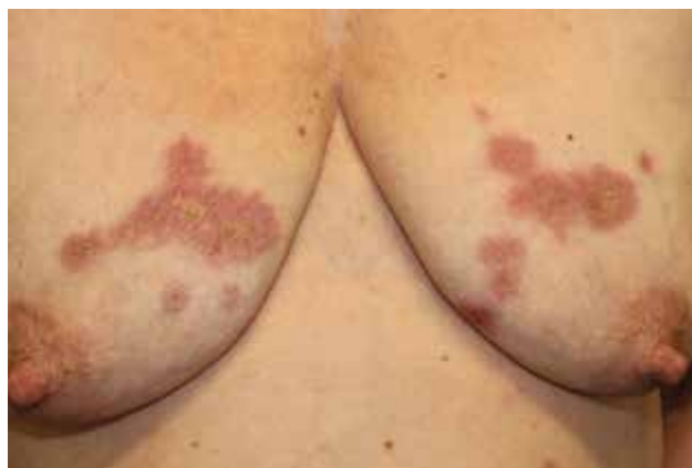
Obr. 2. Necrobiosis lipoidica na trupu (archiv Dermatovenerologické kliniky 1. LFUK a VFN)

Diseminovaná perforující necrobiosis lipoidica je vzácnou formou rozsáhlejšího onemocnění spojená