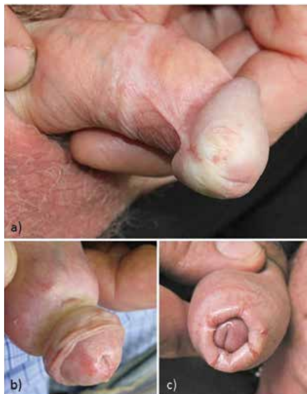
Obr. 5. Bělavě prosáklý glans se zřaseným povrchem, zkrácené frenulum, fibrotický cirkulární prsteneček preputia (a), parařímóza fibrotickým prstencem (b), fimóza pro zúžení preputia s ragádami fragilního fibrotického preputia (c)

Prepubertálně nejčastějším příznakem onemocnění je pruritus, případně pálení, bolestivost, dysurie, konstipace, nejčastějším klinickým nálezem je hypopigmentace a atrofie kůže [2, 58]. Většina nemocných má postižení genitálu, vzácnější je postižení pouze extragenitální [2,9 %], případně současné postižení obou (2,8 %) [2]. Průměrná doba do diagnózy bývá udávána kolem 18 měsíců [2]. Nález jizevnatých změn a hemoragií může vést k podezření na pohlavní zneužívání, navíc jím LS může být vyprovokován či zhoršován v rámci Koebnerova fenoménu. Podezření podporuje nález u starších prepubertálních dívek, špatná odpověď na léčbu, výskyt pohlavně přenosného onemocnění [14, 42]. Někdy bývá popisován výskyt „infantilní perineální protruze“ u prepubertálních dívek v souvislosti s LS. Jedná se o jazykovitou kožní výčlipku v perineálním raphe preanálně, která bývá častěji pozorována v sou-