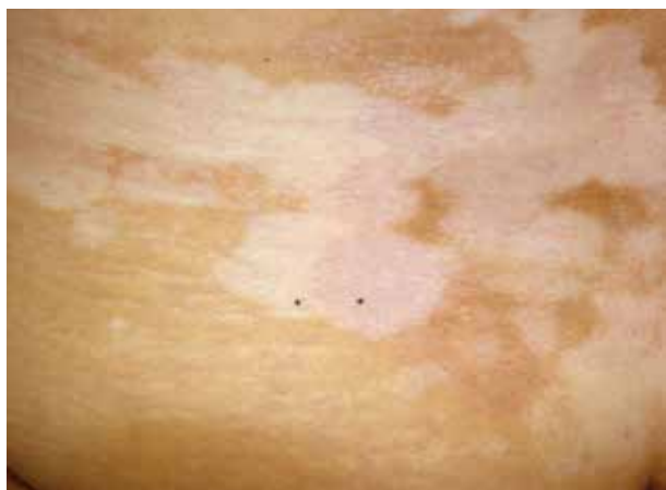
Obr. 1. Jasně bílé depigmentace vitiliga, v jejichž okolí a rozsahu jsou bělavě lesklé makuly až ložiska (černé body – levý v projevu vitiliga, pravý v ložisku lichen sclerosus)

Pro roli imunitního systému u žen svědčí pozorovaný společný výskyt LS s autoimunitními chorobami v 21,5 % případů, v rodinné anamnéze byly přítomné u 21 % a u 42 % byly nalezeny autoprotilátky (proti štítnici, gastrickým parietálním buňkám, hladkému svalu, mitochondriím, antinukleární). Nejčastěji byla pozorována autoimunitní thyreoiditis (12 %) dále alopecia areata, vitiligo, diabetes mellitus a perniciózní anémie [39] – obr. 1. U mužů je výskyt autoimunitních onemocnění výrazně nižší, často se neliší od normální populace, a proto vyšetřování z hlediska těchto onemocnění nebývá doporučováno [25]. U dětí byl pozorován výskyt asi u 1,5 % případů, takřka výlučně dívek (93 %), jednalo se zejména o vitiligo, morfeu, autoimunitní thyreoiditis, alopecia areata [2].