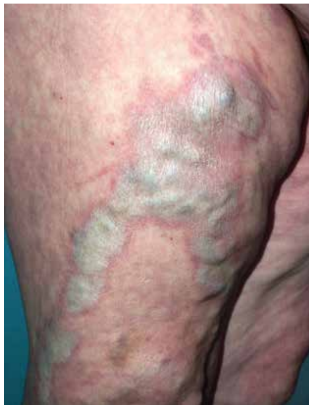
Obr. 2. Koebnerův fenomén – lichen sclerosus nad varikózními žilami