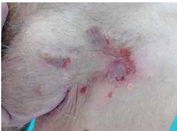
Obr. 1. Eroze s krustami a vezikulami na erytémové spodině