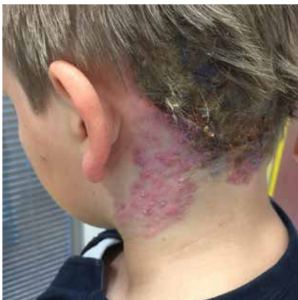
Obr. 1. Ložisko před léčbou