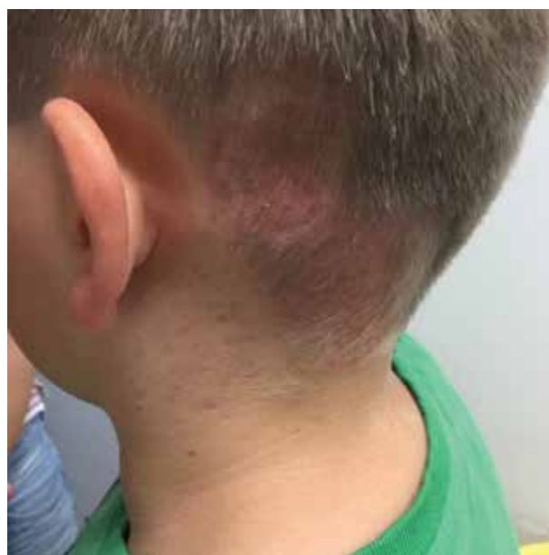
Obr. 3. Ložisko po 3 měsících léčby