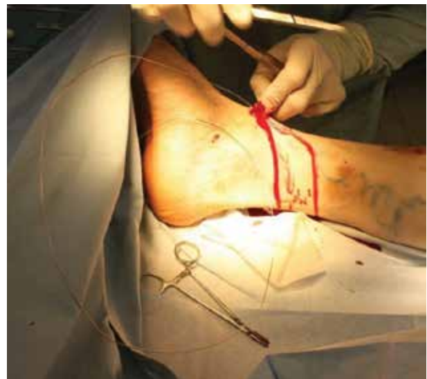
Obr. 6. Zavádění endostriptomu

Nejčastější komplikací je porušení senzitivní inervace – nervus saphenus (obvykle reverzibilní) a krvácení. Další nevýhodou je delší rekonvalescence. Mezi závažnější komplikace chirurgické intervence patří HŽT, plicní embolie (zřídka), tromboflebitida [19, 33, 51]. Výkon je prováděn v celkové, či svodné anestezii. Exstirpace se provádí speciálním nástrojem – endostriptomem (obr. 6). Snaha o limitovaný stripping z důvodu zachování žíly k revaskula-