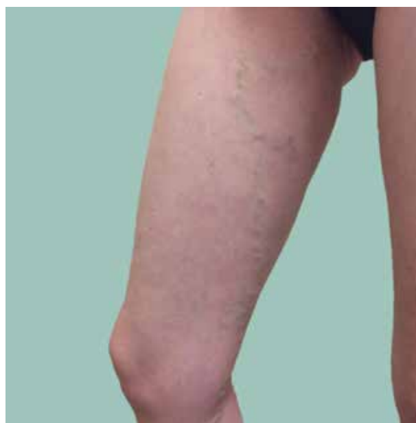
Obr. 1. Vena saphena magna varikózně rozšířená

VSP (obr. 2) je poněkud tenčí, lumen dosahuje zpravidla 3 mm. VSP též začíná na hřbetu nohy a přechází za fibulárním kotníkem na zadní plochu lýtka při zevní straně Achillovy šlachy a poté již přibližně v ose lýtka vedené mezi oběma hlavami m. gastrocnemius nad fascií. Zde je doprovázena nervus suralis . Opět přibírá řadu drobnějších větví z podkoží zadní a zevní plochy lýtka, variabilně i ze stehna. Je i zde vy-