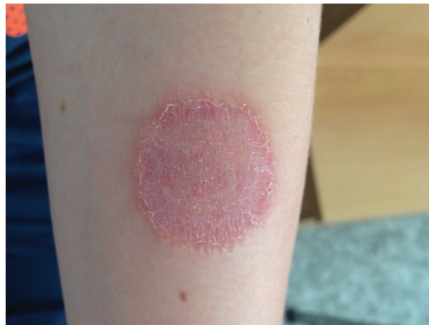
Obr. 3. Tinea corporis na levém předloktí třetího pacienta – červenofialové šupící se ložisko pokryté papulkami

Pacient (chlapec, 12 let) se dostavil k lékaři kvůli rozšiřujícímu se ložisku na levém předloktí. Objektivně bylo zjištěno červenofialové ložisko o velikosti 35 mm šířící se valem do okolí (obr. 3). Ložisko bylo živé, ve středu se šupilo, spíše nesvědilo a bylo pokryto výraznějšími papulkami. Chlapec byl v dětství léčen opakovaně pro ekzém v obličejí, loketních a podkolenních jamkách. Nyní je již delší dobu bez potíží. Rodina doma chovala ježka bělobřichého a babička měla kočku. Na zvířatech nepozorovali žádné klinické známky kožního onemocnění.