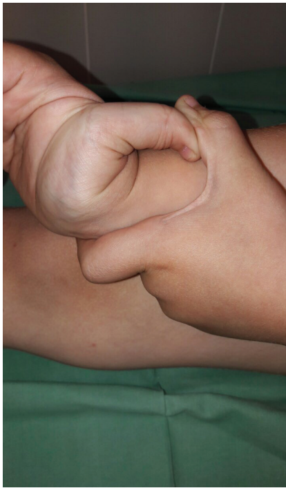
Obr. 1. Pozitivní příznak palce

ditě u matky došlo od 6. týdne k opakovanému krvácení z rodidel, pro hrozící předčasný porod byla hospitalizována. Porod proběhl ve 38. týdnu gravidity spontánně záhlavím, porodní hmotnost byla 3 200g a délka 50 cm. Poporodní adaptace novorozence byla v normě. Pro výrazné krvácení během porodu byla matce podána transfuze. Matka pacienta měla typické znaky Ehlersova-Danlosova