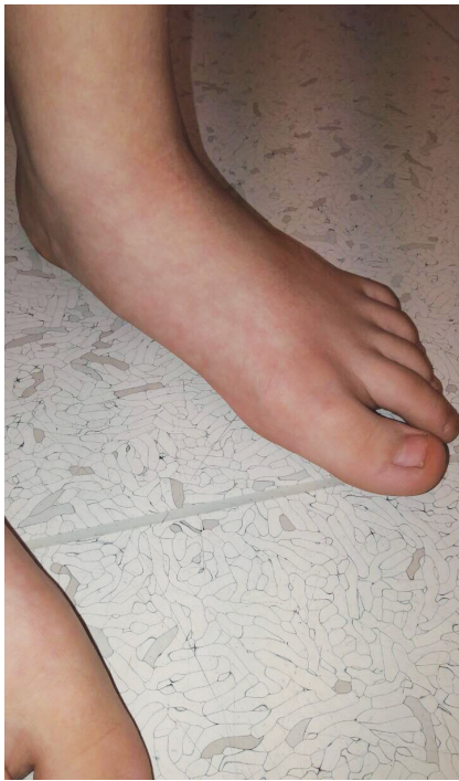
Obr. 5. Planovalgózní postavení nohou

2 x 3 cm na obou bérkách (obr. 3, 4). Na pravém bérce ventrálně byla přítomna poloměsíčitá jizva velikosti cca 4 cm. Nad pravým zevním kotníkem měl okrouhlé ložisko hyperpigmentace velikosti asi 2 x 2 cm, pedes plani, vadné držení těla (obr. 5, 6).