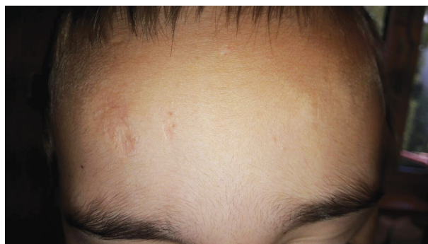
Obr. 3. Jizva charakteru cigaretového papíru na čele

syndromu – těstovité podkoží, rozeklané jizvy, hematomy na bérkách, hyperelasticitu kůže, hyperflexibilitu kloubů, kyfoslózu, chronickou žilní insuficienci.