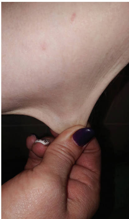
Obr. 2. Velká kožní řasa

ditě u matky došlo od 6. týdne k opakovanému krvácení z rodidel, pro hrozící předčasný porod byla hospitalizována. Porod proběhl ve 38. týdnu gravidity spontánně záhlavím, porodní hmotnost byla 3 200g a délka 50 cm. Poporodní adaptace novorozence byla v normě. Pro výrazné krvácení během porodu byla matce podána transfuze. Matka pacienta měla typické znaky Ehlersova-Danlosova