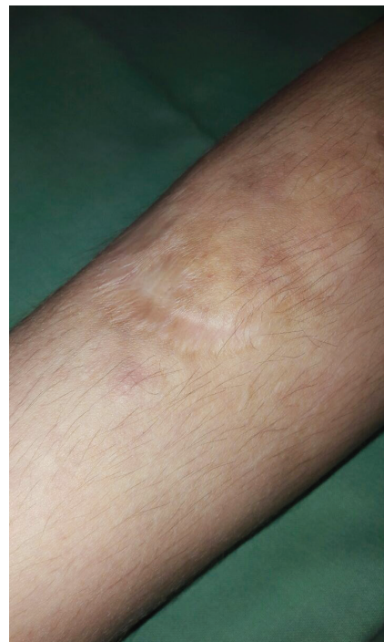
Obr. 4. Atofické rozeklané jizvy a hematomy na bérce

V kojeneckém věku byl pacient hospitalizován pro neprospívání. Ve 4 letech měl frakturu pravé klavikuly a v 5 letech si způsobil tržnou ránu na bérce vyžadující suturu, která se zhojila rozeklanou atrofickou jizvou. U pacienta byly typické známky klasické formy Ehlersova-Danlosova syndromu. Jemná, hebká kůže s nadměrnou kožní řasou, těstovité podkoží, hyperflexibilita kloubů, pozitivní příznak palce (obr. 1, 2). Na čele měl jizvy charakteru cigaretového papíru, na bérkách byla patrna atrofická kůže v místě resorbujících se hematomů, hematomy průměru