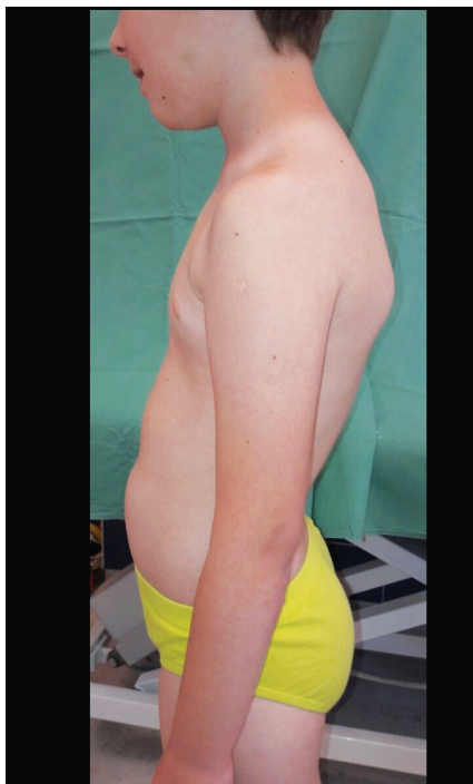
Obr. 6. Vadné držení těla

Pacientovi byl odebrán vzorek kůže k histologickému vyšetření. Ultrastrukturální obraz prokázal nález kompatibilní s Ehlers-Danlos syndromem. U kolagenních