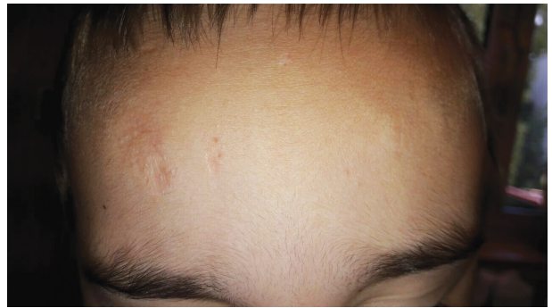
Obr. 3. Jizva charakteru cigaretového papíru na čele

syndromu – těstovité podkoží, rozeklané jizvy, hematomy na bérkách, hyperelasticitu kůže, hyperflexibilitu kloubů, kyfokoliózu, chronickou žilní insuficienci.