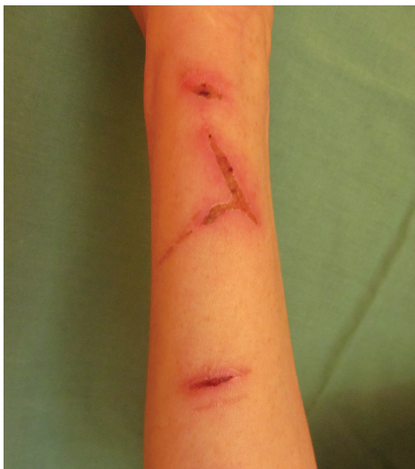
Obr. 1a) Lineární exkoriace na předloktí