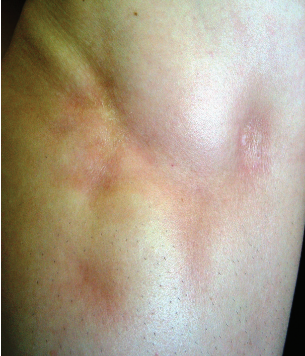
Obr. 11. Hluboká forma

ným funkčním, kosmetickým a psychologickým následkům s výskytem artralgií a artritid postižené končetiny asi u 30–50 % nemocných. Nejznámější je frontoparietální forma („en coup de sabre“) projevující se sklerotickým pruhem probíhajícím paramediálně na čele s přesahem do kštice, se vznikem jizvící alopecie, vzácně zasahující pod úroveň obočí, která může být spojena s poruchami centrálního nervového systému (kalcifikacemi falx cerebri, cefalgiemi, epileptickými záchvaty) a očními komplikacemi (uveitidou, episcleritidou, změnami adnex víček a poruchou jejich hybnosti) u 3,2 % nemocných dětí (obr. 9). U osob se změnami centrálního nervového systému a známkami aktivity choroby jsou proto doporučovány pravidelné oční kontroly v intervalu čtyř měsíců po prvních třech letech [56, 55].