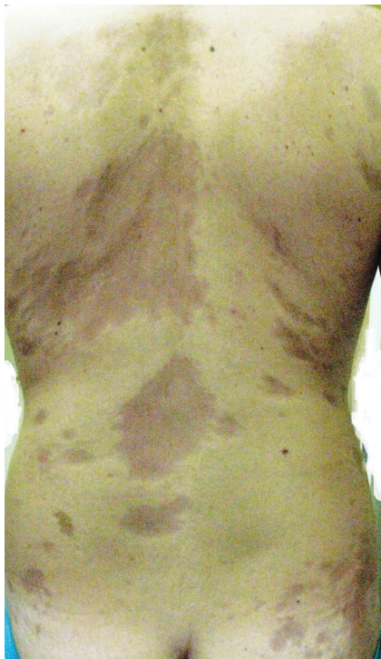
Obr. 3. Atrophoderma idiopathica Passini-Pierini

či mnohočetnými, symetrickými, ostře ohraničenými, šedohnědými, měkkými, někdy lehce vkleslými makulami, které jsou stejného vzhledu jako odeznělý projev morfeje (obr. 3).