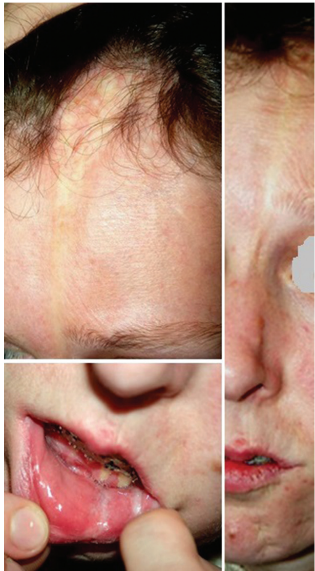
Obr. 9. Frontoparietální forma – „en coup de sabre“