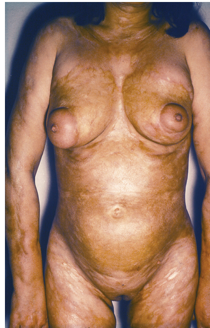
Obr. 4. Generalizovaná forma

Pansklerotická invalidizující morfea je vzácná forma generalizované LS vznikající často jako smíšená lineární a diseminovaná forma s cirkulárním postižením končetin a/nebo