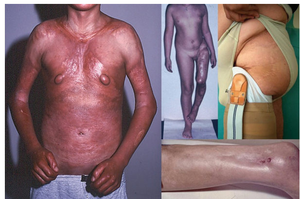
Obr. 5. Pansklerotická morfea

Eozinofilní fasciitida je onemocnění mnohými autory považované za formu generalizované LS [25], primárně postihující zánětlivým fibrotickým procesem fascii, případně podkožní tukovou tkáň, dermis a sval. Klinicky se projevuje náhlým vznikem bolestivých dolíčkujících symetrických otoků (zpravidla končetin, bez postižení rukou a nohou), které přechází v induraci. Retrakce fibrotizovaných vazivových sept podkožní tukové tkáně podmiňuje typický dolíčkovaný, „matracovitý“ vzhled (obr. 6) povrchu kůže v místech s větším tukovým polštářem (nejčastěji vnitřní strany paží, stehna). Laboratorně je provázena zvýšenou sedimentací krve, hypereozinofilií a hypergamaglobulinémií. Asi ve 30 % se nachází projevy ložiskové morfeje, které často vznikají před či po akutní fázi fascitidy [33].