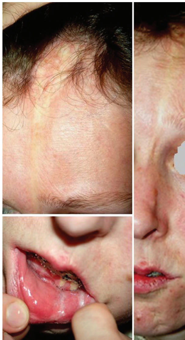
Obr. 9. Frontoparietální forma – „en coup de sabre“