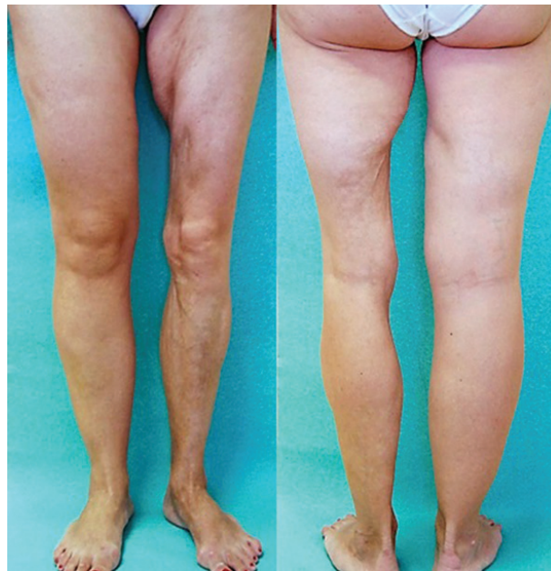
Obr. 8. Lineární forma se vznikem v dětství