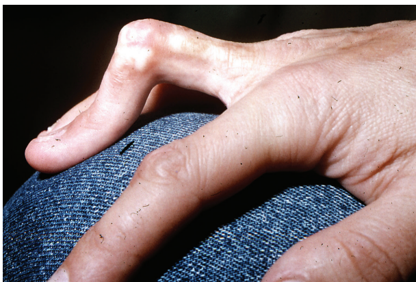
Obr. 7. Flekční kontraktura

Lineární LS je nejčastější formou u dětí [56]. Projevuje se jako pruhy tuhé kůže, nejčastěji na končetinách, které mohou sledovat Blaschkovy linie. V případě hlubokého postižení může vést v místech přemostujících klouby k flekčním kontrakturám (obr. 7), atrofii podkoží, případně svalů, a zpomalení růstu končetiny (obr. 8). U dětí má závažnější průběh než u dospělých a častěji vede k výraz-