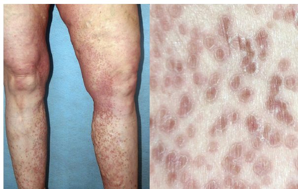
Obr. 6. Porokeratosis superficialis disseminata

PPT popsal poprvé v roce 1995 Lucker et al. Označení vychází z řeckého ptyché (záhyb) a tropé (obrat), čímž zdůrazňuje flexurální lokalizaci lézí. Onemocnění připomínající inverzní psoriázu je charakterizováno mnohočetnými asymetrickými vyvýšenými ložisky červeno-hnědé barvy, která jsou ostře ohraničená, se šupinami na