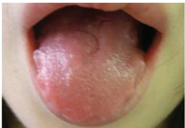
Obr. 10. Alergická kontaktní cheilitida granulomatózního typu po solích rtuti v amalgámu