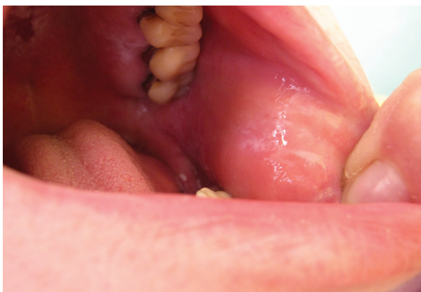
Obr. 9. Alergická kontaktní stomatitida lichenoidního typu v dutině ústní po amalgámu