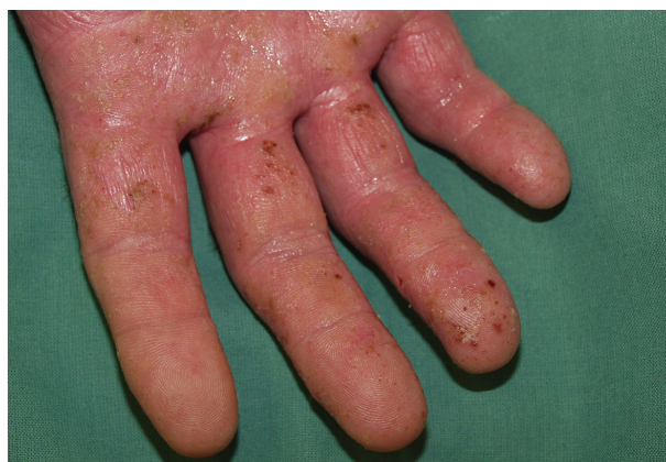
Obr. 12. Proteinová kontaktní dermatitida dysidrotického typu po bílkovině latexu

rukou, předloktích (obr. 7), na obličeji, ve výstřihu a na krku. Při přetrvávajícím kontaktu se alergen přenáší prsty, oděvem na místa vzdálenější (sekundární lokalizace). Projevy akutní dermatitidy zahrnují živě červené makuly, papuly či makulopapulky velikosti špendlíkové hlavičky, uspořádané do trsů či skupinek. Při vystupňované závažné reakci se objevují vezikuly, buly, mokvání, tvorba krust nebo šupin (obr. 8). Pro chronickou dermatitidu jsou typické červenohnědý erytém s/bez papulovezikul, deskvamace, hyperkeratózy, tvorba ragád a lichenifikace [27, 28, 39, 44, 59].