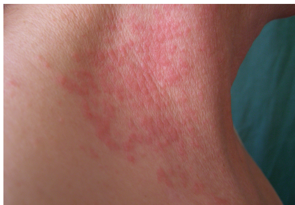
Obr. 11. Airborne alergická kontaktní dermatitida po kalafuně