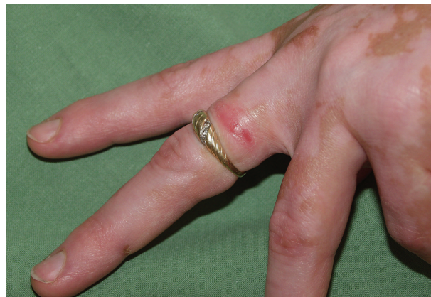
Obr. 2. Iritací reakce pod šperkem