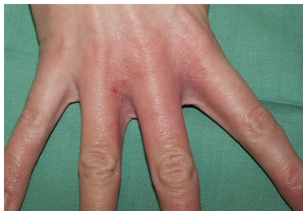
Obr. 1. Iritací reakce v mezprstí rukou („mokrý práce“, saponáty)

2. Iritací reakce – na kůži zjišťujeme mírné známky zánětu (suchost, diskrétní olupování, zarudnutí). První