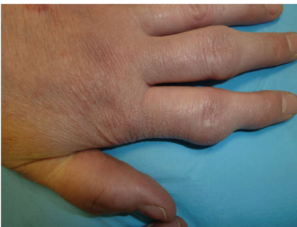
Obr. 3. Deformity ručních kloubů

Na palmární straně prstů obou rukou byly patrné běložlutavé tuhé uzlíky do 5 mm velké, místy jakoby se vylučoval křídový materiál (obr. 1, 2). Okolo loktů, zápěstí a proximálních interfalangeálních kloubů prstů ruky byly nebolestivé až 3 cm velké hnědavě červené hrboly a deformity (obr. 3). Z projevu na prstu byla provedena probatorní excize, histopatologické vyšetření prokázalo dnavé tofy. Kožní nález při biologické léčbě byl minimální se skórem rozsahu a závažnosti psoriázy PASI <1.