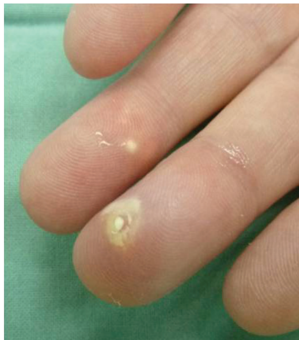
Obr. 1. Tofy na prstech

Žena (47 let) se závažnou psoriázou léčenou biologickou léčbou si při pravidelné kontrole stěžovala na nově vzniklé bolestivé uzlíky na prstech. Lupénku měla od 20 let věku, asi od 30 let se začala léčit na revmatologii v místě bydliště pro psoriatickou artritidu, nejdříve metotrexátem a poté leflunomidem, krátce měla i celkové kortikosteroidy v nízké dávce. Na naší klinice byla léčena infliximabem od roku 2008, poté etanerceptem a od roku 2010 adalimumabem s velmi dobrým účinkem na kožní i kloubní postižení. Během sledování na našem pracovišti si jen občas stěžovala na bolesti a otoky kloubů, což jsme přisuzovali současné psoriatické artritidě. Nemocná byla obézní (BMI 31) a léčena pro hypotyreózu, při cíleném dotazování poslze přiznala každodenní popíjení několika piv a příležitostně i pár sklenek tvrdého alkoholu. V laboratoři měla dlouhodobě zvýšené jaterní testy včetně glutamyltransferázy, v době zmiňovaného vyšetření pak byla zjištěna extrémně vysoká hladina kyseliny močové (600 \mu\text{mol/l} ; norma 140–360 \mu\text{mol/l} ), hypertriglyceridémie a hypercholesterolemie. Sonografie břicha prokázala steatózu jater.