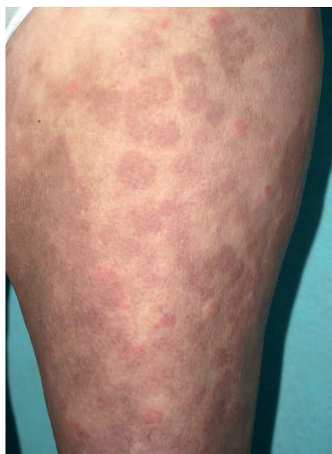
Obr. 1. Urtikariální vaskulitida

Mimo zmíněné se do této zvláštní skupiny kopřivkových syndromů řadí též Gleichův syndrom (epizodický angioedém s eozinofilií) a Wellsův syndrom (granulomatózní dermatitida s eozinofilií), urticaria pigmentosa, cvičením (námahou) indukovaná anafylaxe a konečně i klasická urtikariální vaskulitida . Histologicky se jedná o leukocytoklastickou vaskulitidu (leukocytární infiltrát s rozpadajícím se jádrem, fibrinoidní nekróza cévní stěny), kopřivkové projevy trvají déle než 24 hodin, spíše pálí než svědí, často má hemoragický charakter, může zanechávat pozánětlivé erytémy či pigmentace (obr. 1) a angioedém ji doprovází naprosto výjimečně. Může provázet systémový lupus erytematosus, Sjögrenův syndrom, kryoglobulinémií či hypokomplementémií.