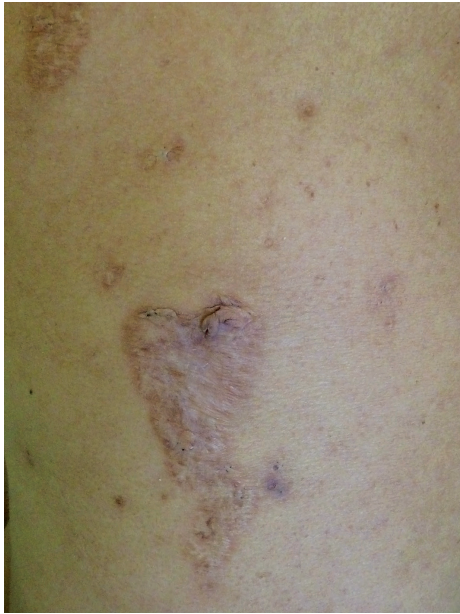
Obr. 5. Kribriformní jizvy po zhojeném pyoderma gangrenosum u pacientky s PASH

(obr. 5). Léčba zahrnuje kortikosteroidy (15–60 mg/den), anti-TNF biologika (infliximab, etanercept), zkouší se i anakinra, cyklosporin, thalidomid [9, 13].