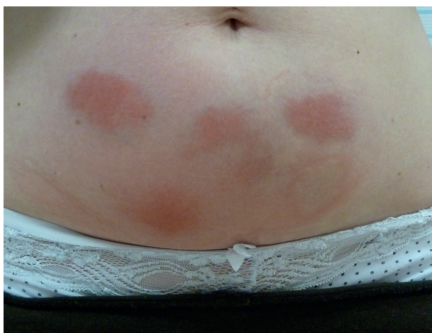
Obr. 2. Reakce v místě aplikace injekcí anakinry u pacientky léčené pro HIDS

Monogenní syndromy vznikají na podkladě mutací genů pro proteiny vrozené imunity, které jsou součástí NLRP3 inflamasomu, cytokinových receptorů či jejich antagonistů, nejčastěji jde o geny pro pyrin a TNF receptory. Výsledkem mutací je porušená regulace vrozené imunity s abnormální aktivitou interleukinu 1 \beta a přetrváváním leukocytů ve tkáních, takže i mírné podněty pak mohou vyvolat nepřiměřenou zánětlivou reakci. Laboratorně