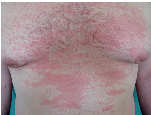
Obr. 4. Exantém při Stillově nemoci

z lymfocytů, histiocytů a neutrofilů, při imunofluorescenci IgM uloženy v papilách koria a podél bazální membrány (obr. 3).