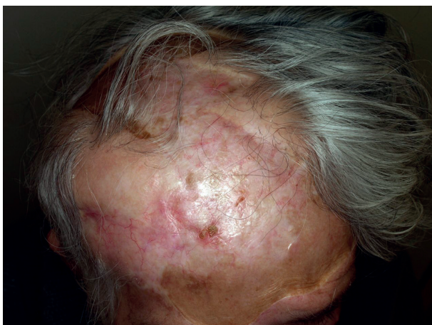
Obr. 3. Klinický nálezn bezprostředně po ukončení léčby (prosinec 2014)

o terapii 119 pacientů s lokálně pokročilým nebo metastatickým bazaliomem. Průměrná léčba vismodegibem byla 5,5 měsíce (rozmezí 0,4–19,6). Lék byl podáván perorálně v dávce 150 mg denně ve 28denních cyklech a po 1–2 cyklech se provádělo kontrolní vyšetření. Léčba se přerušila v případech progresu nádoru, výrazných vedlejších účinků nebo na žádost pacienta. Dávku léku nebylo možná snížit, ale v případech toxických projevů se léčba mohla až na 8 týdnů přerušit. Pozitivní léčebná odezva byla zaznamenána u 46,4 % lokálně rozvinutého a 30,8 % metastatického bazaliomu. Průměrná doba sledování byla 6,5 měsíce (rozmezí 1,4–20,6).