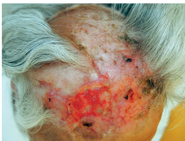
Obr. 2b. Klinický nálezn před zahájením léčby (červen 2014)