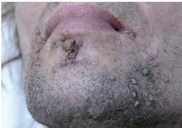
Obr. 1. Verrucae vulgares u HIV pozitivného pacienta na brade a v periorálnej oblasti

Pacient je monitorovaný pre HIV infekciu a v súčasnosti liečený trojkombináciou spomínaných anti-HIV liekov, ktorú užíval aj počas lokálnej liečby HPV infekcie 5% imiquimodom. Lokálna terapia imiquimodom sa aplikovala cielene na prejavy 3x týždenne počas 1 mesiaca. Postupne došlo k deštrukcii patologických lézií iba s miernou lokálnou reakciou v podobe erytému. Iné lokálne ani celkové vedľajšie účinky neboli zaznamenané. Počas ročného sledovania je pacient bez prejavov HPV infekcie.