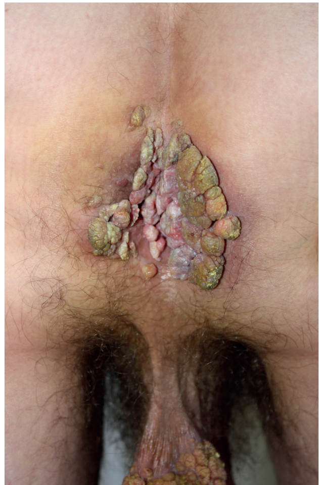
Obr. 2. Condylomata acuminata gigantea lokalizované perianálne

CT prítomná atrofia mozgu. V epidemiologickej anamnéze uviedol viaceré, aj náhodné nechránené sexuálne vaginálne kontakty. U partneriek podobné prejavy nepozoroval. Sexuálny pomer s mužmi negoval. Dopusiaľ absolvovaná lokálna terapia tekutým dusíkom a 5 % imiquimodom v kréme bola s minimálnym účinkom a pre nedostačujúcu spoluprácu pacienta boli obidve liečebné metódy aplikované len krátku dobu. Pre slabé sociálne správanie bol pacient posledných 2,5 mesiacov bez liečby. Pacient subjektívne pociťoval bolestivosť v mieste lézií. Kvôli rozsiahlej tumoróznej mase na skrôte mal ťažkosti pri chôdzi, čo ho priviedlo znovu k dermatológovi. Pri vyšetrení boli v uvedených lokalitách prítomné početné, na povrchu drsné karfiolovité útvary papilomatózneho vzhľadu na pohmat mäkkej konzistencie, s výraznou fragilitou lézií v perianálnej lokalizácii. Farba lézií kolísala od ružovej, hneď až po zeleno sfarbené patologické prejavy s výrazným odórom a secernáciou spolu so spontánnym krvácaním, ktoré sa zväčšovalo pri palpácii. Na oboch rukách mal početné vulgárne bradavice veľkosti od 3 do 5 mm.