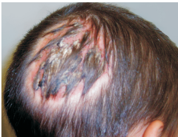
Obr. 1. Tinea capitis vyvolaná A. benhamiae (kerion Celsi)