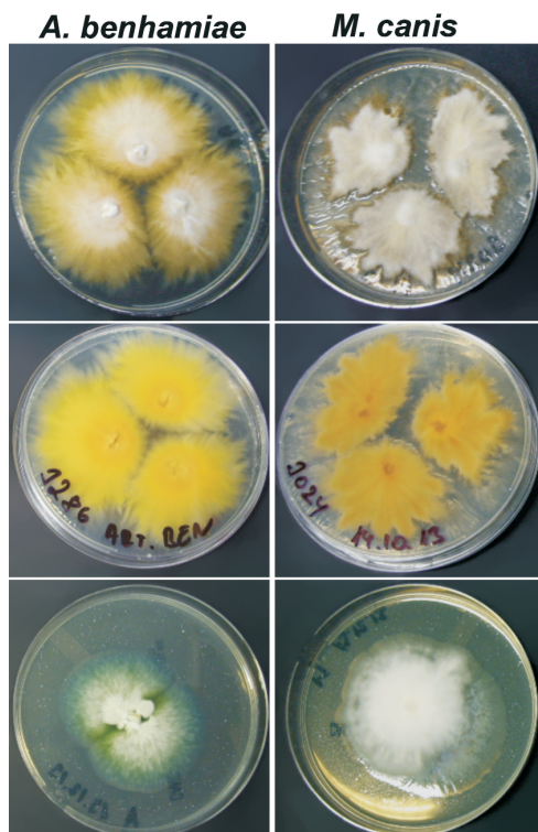
Obr. 4. Srovnání kolonií M. canis a A. benhamiae . První řada: kolonie na Sabouraudově glukózovém agaru s chloramfenikolem po 3 týdnech kultivace při 25 °C; druhá řada: reverz kolonií; třetí řada: zabarvení na chromogenním agaru Candiselect 4.

zkoumaných médiích (viz obr. 3). Zatím nebyl popsán, a ani my jsme nezaznamenali, žádný vztah mezi fenotypem a genotypem ITS rDNA. Oba fenotypy mají i identický profil proužků při PCR-fingerprintingu s M13-core