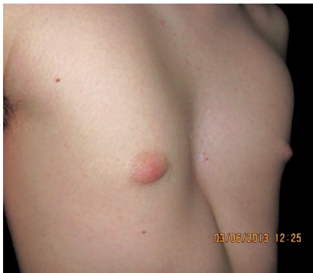
Obr. 2 b. Vpáčený hrudník