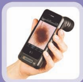
Ruční digitální dermatoskop