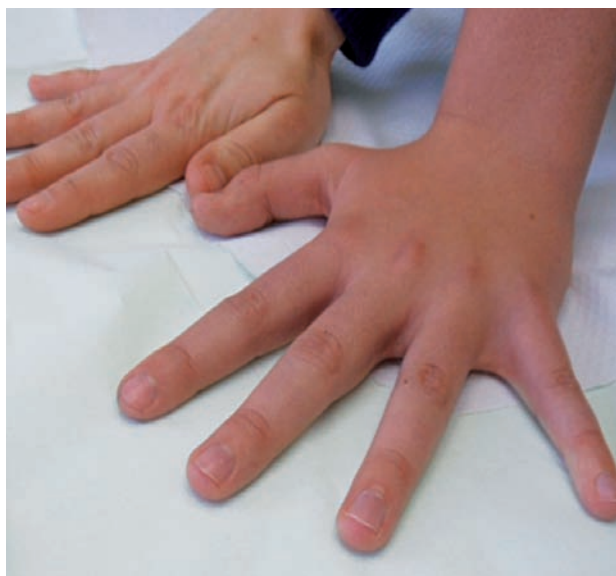
Obr. 2 a. Srovnání ruky nemocného a jeho matky

(arachnodaktylie) a výrazněji vpáčený hrudník (obr. 2a, b), skoliózu, zkrácení levé dolní končetiny o 7 mm. Oční vyšetření ozřejmilo oboustrannou hypermetropii (sníženou zrakovou ostrost a absenci konvergentního souhybu), kardiologické vyšetření zjistilo lehkou dilataci aortálního bulbu svědčící pro Marfanův syndrom. Histologické vyšetření prokázalo v dilatovaném infundibulu vlasového folikulu velký hyperkeratotický čep tvořený jemným keratinem, v něm stočený velusový vlas s přítomností malého množství tkáňového detritu s nekrotickými polynukleáry – tento spojuje dva sousední vlasové folikuly. Epiteliální stěna folikulu je poměrně tenká, v okolí je mírná fibrotizace a perivaskulárně malé infiltráty lymfocytů s nečetnými histiocyty a plasmocyty. V jednom místě je i drobný granulom z cizích těles, reakce na keratin, pravděpodobně z perforovaného folikulu. Ložiskovitě je ve fibrotizované části koría patrná redukce až vymizení elastických vláken. Závěr histologického vyšetření: popsany obraz je v souladu s diagnózou atrophoderma vermiculata (obr. 3).