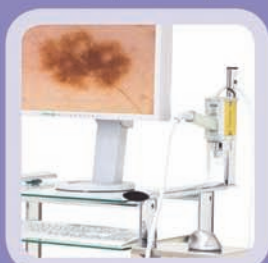
Nejvyšší obrazová Full HD kvalita