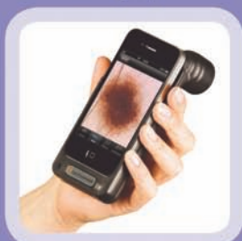
Ruční digitální dermatoskop