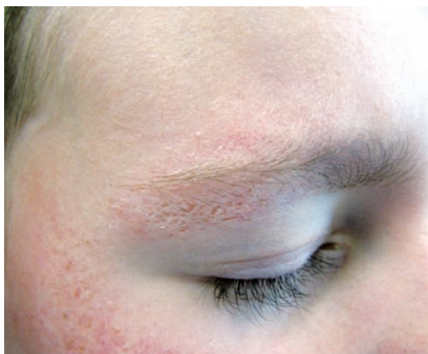
Obr. b. Změny na obočí