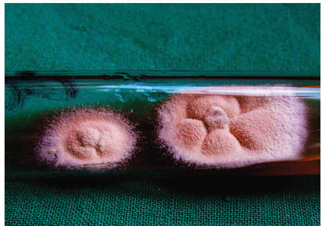
Obr. 3 a. Kultúra izolovaná zo šupín na ložisku – Trichophyton tonsurans

Ďalšími vyšetreniami sme zistili zvýšené markery zápalu FW 74/118, CRP 55,9 mg/l (norma do 10), Le 14,84 x 10 9 , znížené hodnoty Er: 3,61 x 10 12 , hemoglobínu 10,1 g/dl a hematokritu 30,2 %. Glukóza, hepatálne testy, úrea boli vo fyziologických hodnotách. Z hnisu sa kultiváciou zistili Staph. koaguláza negat. a Enterococcus faecalis. Boli stanovené diagnózy Tinea capitis profunda, Lymphadenitis occipitalis et colli a hypochromná anémia. Dieťa bolo liečené terbinafinom 125 mg p. o. denne 4 týždne, axetilcefuroximom 125 mg/5 ml v sirupe p. o. každých 12 hodín 10 dní, lokálne obklady KMnO 4 , mechanické odstránenie vlasov, Saloxyl ung., sol. iodi spirit. 5%, sírodecht 8% ung. Teplota ustúpila na štvrtý deň, bolestivosť, hnisanie, zápal aj infiltráty počas 2 týždňov. Markery zápalu pri kontrole o 11 dni boli vo fyziologických hodnotách.