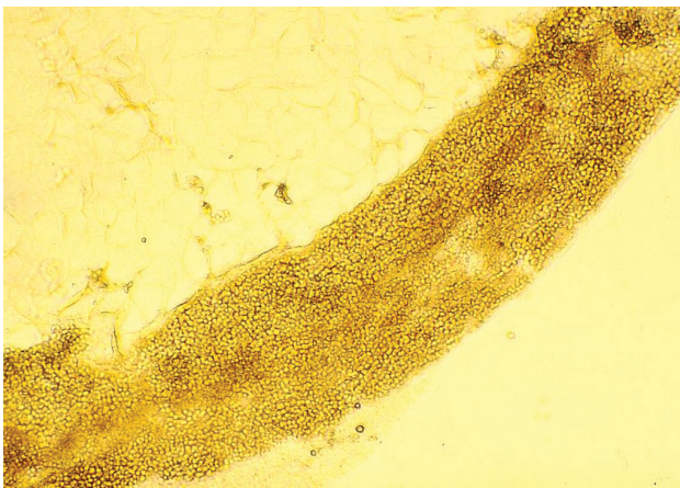
Obr. 2. Mikroskopický obraz vo vlase – typ endothrix

ných vlasov sa objavili ďalšie mierne infiltrované ložiská veľkosti 1–3 cm, spolu 12, s chýbajúcimi vlasmi, na okrajoch s krátkymi odlámanými vlasmi v rôznej výške (obr. 1). Mykologické mikroskopické vyšetrenie šupín odhalilo septované vlákna. Vyšetrenie vlasov preukázalo spóry v retiazkach vo vnútri vlasov – typ parazitizmu endothrix (obr. 2). Mykologická kultivácia s výsledkom Trichophyton tonsurans bola urobená v Mykologickom laboratóriu Detskej dermatovenerologickej kliniky LFUK a DFNSP. Kolónie mali svetlo hnedú farbu, jemný povrch podobný zamatu s výrazne sprehybaným povrchom a spodnej strane hnedé zafarbenie (obr. 3 a, b). Mikroskopickým vyšetrením z kolónií sme zistili relatívne široké hýfy s početnejšími septami s vetvením v pravom uhle, mikrokonídie rôznych tvarov a veľkostí, ojedinelé chlamydo-spóry.