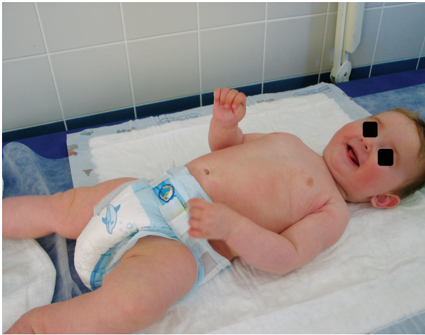
Obr. 5. Stav v 7 měsících věku

Od devátého dne hospitalizace se nové puchýře netvořily. Pacient byl propuštěn do domácí péče čtrnáctý den jen s drobnými krustičkami v dlaních a na ploskách. Sliznice byly nadále nepostíženy. V ambulantní péči byly ponechány lokální kortikosteroidy, 1krát denně pouze jeden týden po hospitalizaci, poté byla kortikoidní externa vysazena. V dalším průběhu v lokální terapii byla aplikována již jen emolienca. Do dvou týdnů od propuštění, tj. od pěti měsíců věku dítěte, byla kůže zcela zhojena (obr. 5). Od dalšího očkování hexavakcínou bylo ustoupeno.