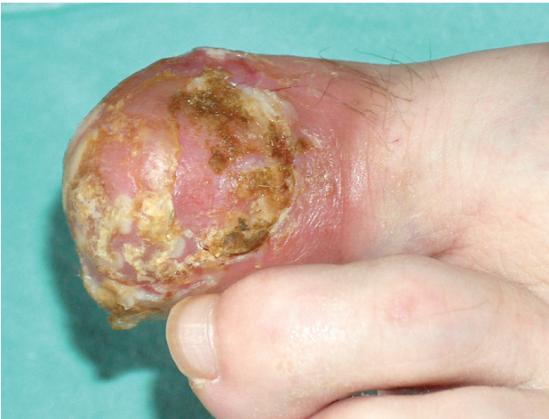
Obr. 4. Pustulózní psoriáza s destrukcí nehtu po terbinafinu. Pacientka měla původně minimální psoriatická ložiska na predilekčních místech.

což prokázaly histologické studie. Pigmentace se zpravidla objevuje po 8 týdnech léčby a mizí po vysazení léku [16, 19, 31]. Glaser [17] však uvádí čtyři případy pacientů s HIV, u kterých se modravá nehtová dyschromie vyskytla bez asociace s azidothymidinem.