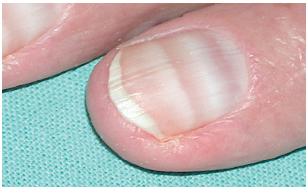
Obr. 6. Muehrckeho transverzální linie po imanitibu

U dětí matek léčených v těhotenství difenylhydatoinem, karbamazepinem nebo valproátem byla popsána hypoplazie nehtů.