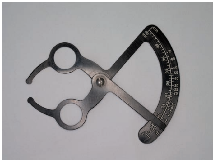
Obr. 3. Hynieho testimetr

řit testimetrem (orchidometrem), např. u nás stále používáme Hynieho testimetr [5] – obrázek 3. Varlata s objemem pod 2 ml jsou zpravidla provázána neplodností. Dále posuzujeme rezistenci varlat nebo zvětšení nadvarlete , jehož agenze je spojena s azoospermii. Vyšetřujeme přítomnost hydrokély , hematokély , spermatokély a hlavně varikokély . Tento konvolut abnormálně dilatovaných, varikózně změněných žil z plexus pampiniformis, označovaný jako idiopatická varikokéla a vyskytující se v běžné mužské populaci v 15 %, zachytíme při komplexním vyšetření muže ze sterilního páru až ve 40 % [17]. Varikokéla je nejčastější příčinou mužské neplodnosti. Její přítomnost musí být správně detekována u pacientů s abnormálním nálezem spermioqramu, včetně azoospermie. Operační řešení varikokély vede ke zlepšení kvality spermatu u 70–80 % pacientů [20]. Klinicky posoudíme i hmatnou část funikulu a per rectum vyšetříme prostatu .