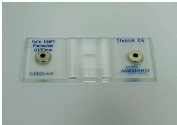
Obr. 1. Thomova komůrka

Většinou, ale není to pravidlem, jsou všechna kritéria v určitém vzájemném souladu. Bez klinického vyšetření, popř. dalších výsledků, nelze úroveň plodnosti dobře zhodnotit.