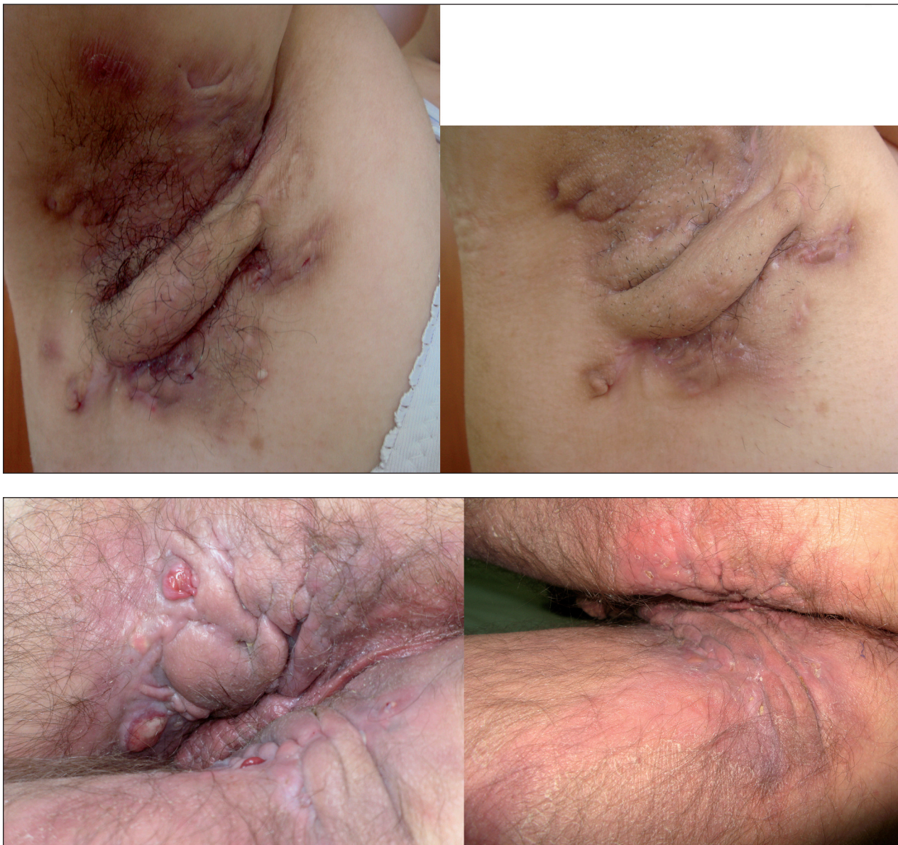
Obr. 1A, 1B. Hidradenitis suppurativa s axilárním a perianálním postižením před terapií a 4 měsíce po nasazení adalimumabu

Po šesti měsících léčby adalimumabem byla průměrná redukce bolesti o 81 % a průměrná redukce sekrece o 54 %. Stabilizovaný stav onemocnění byl udržován od 6. do 12. měsíce terapie u všech sledovaných. Stabilizovaný stav se začal opět postupně zhoršovat po vysazení terapie během období sledování a u šesti pacientů jsme v této době zaznamenali relaps. Po 24 měsících byla průměrná redukce bolesti o 59 % a redukce sekrece o 48 %.