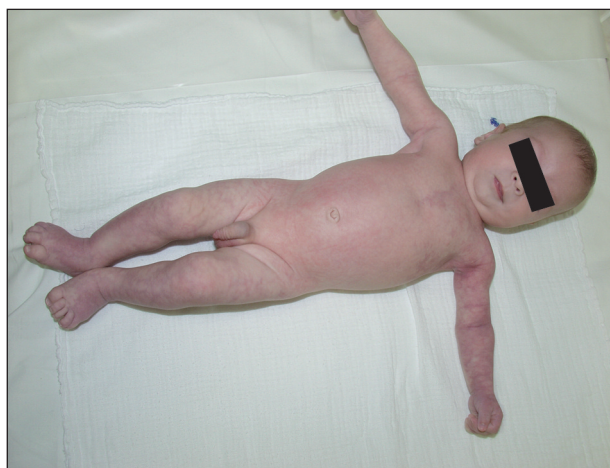
Obr. 3. Celkový pohled.

V současnosti je chlapci 20 měsíců, je pravidelně sledován neonatologem, neurologem, ortopedem a očním lékařem. Dosud nebyla diagnostikována žádná z asociovaných abnormalit. Zpomalený psychomotorický vývoj výrazně postoupil, neurolog konstatuje jen opožděný nástup řeči. Kožní nález zůstal nezměněn, asymetrie končetin je stacionární.