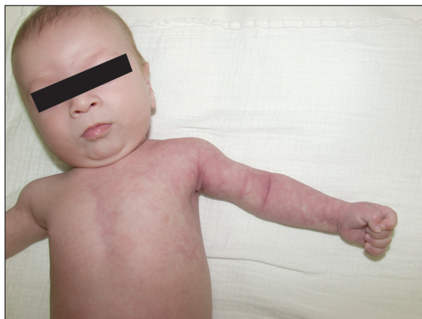
Obr. 1. Postižení na horní končetině a hrudníku.

Během vyšetření ve věku 3 měsíců jsme na dermatovenerologické klinice pozorovali výraznou retikulární cévní kresbu červenofialové barvy na obou horních i dolních končetinách a přilehlých segmentárních částech hrudníku s ostrým ohraničením nad sternem – obrázky 1, 2 a 3. Zaznamenali jsme asymetrii končetin, levá dolní končetina byla o 0,5 cm delší než pravá a výrazně hypotrofická ve srovnání s pravou dolní končetinou. Ostatní kožní nález byl fyziologický.