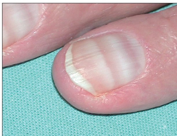
Obr. 10. Meeovy linie na nehtech po imatinibu.

Klinické zkušenosti s léčením dalšími inhibitory jsou zatím omezené, kožní reakce se uvádějí u dasatinibu. Dasatinib vyvolává erytémy, exantémy a „exfoliativní der-