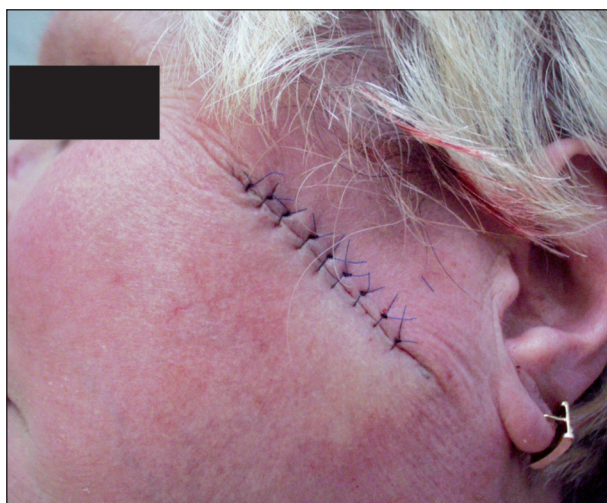
Obr. 1. Rána uzavřená primární suturou jednoduchými uzlovými stehy.

Primární sutura je nejčastěji využívaným uzávěrem operační rány v kožní chirurgii (obr. 1). Nevhodnější tvar excize uzavírané primární suturou je tvar vřetenovitý, člunkovitý. Poměr délky excize k její tloušťce by měl být 2–3:1, s úhlem asi 30°. Podélná osa excize by měla, je-li to možné, respektovat průběh tzv. ohybových linií (RSTL – relaxed skin tension lines). V nich lze nejlépe skrýt následnou jizvu. Průběh těchto linií v podstatě odpovídá