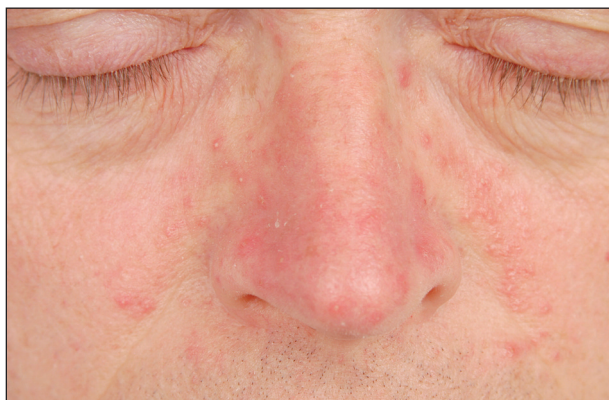
Obr. 2. Papulopustulózní rozacea.

Představuje klasický typ rozacey. Je charakterizována perzistentním centropaciálním erytémem a současně přítomností papul a pustul , které jsou rovněž lokalizovány centropaciálně (43) (obr. 2). Zánětlivé projevy opět vynechávají periorbitální oblast, což je velmi typickým znakem. Subjektivně se může objevit pálení. Na rozdíl od erytematotelangiektatického typu nemají zevní faktory tak velký význam v iritaci kůže. Mírně může být přítomen flushing a teleangiektázie. V důsledku zánětlivých změn někdy vzniká v obličeji chronický edém, který je u některých mužů kombinován s fymatózními změnami.