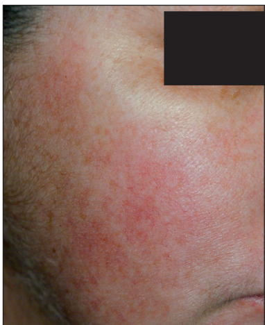
Obr. 1. Erytematotelangiektatická rozacea.

Pro tento typ rozacey je typický flushing – zprvu přechodný, pak trvalý erytém. Důležitá je jeho frekvence, doba trvání, rozsah a intenzita. Flushing u rozacey trvá většinou déle než 10 minut, čímž se liší od krátkodobého