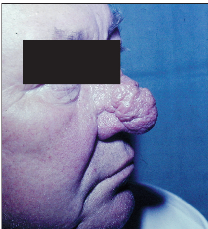
Obr. 4. Rhinophyma.

ní, řezání, svědění, nesnášenlivost světla. Dále může být přítomna hyperémie spojivek, blefaritida, konjunktivitida, teleangiektazie a nepravidelnost okrajů očních víček (3, 43). U některých pacientů může dojít k poruchám vizu následkem postižení rohovky (keratitis). Často se objevuje chalazion nebo hordeolum (43). Oční postižení může předcházet kožní změny řadu let – dle některých studií zhruba u 20 % pacientů s okulární rozaceou se objevuje oční postižení před kožní manifestací (43). Asi u poloviny pacientů jsou nejprve přítomny kožní změny a teprve potom dochází k očnímu postižení (43). Proto by každý pacient s kožními projevy rozacey měl být vyšetřen oftalmologem. Oční rozacea bývá často poddiagnostikována a je léčena pod jinými diagnózami, často nevhodnými antibiotiky.