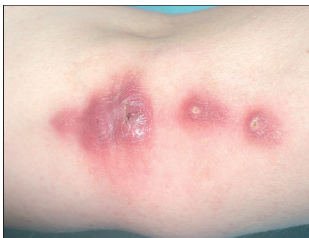
Obr. 2. Abscedující noduly na vnitřní oblasti lokte.

Postupně došlo k odchlípení nehtové ploténky, ke spontánní ablacii však nedošlo. Následně vznikl červený nebolestivý nodulus na dorzu ruky. Pro výraznou bolestivost prstu navštívila v 1/07 chirurgickou ambulanci, kde byl lokálně aplikován Višněvského balzám. Vzhledem k přibývání nebolestivých nodulů navštívila spádového dermatologa. Byla léčena antibiotiky lokálně a celkově (2 měsíce Deoxymykoin, 1 měsíc Augmentin), avšak bez efektu. Většina nodulů hojně produkovala hnisavý sekret. Aerobní a anaerobní kultivace byly negativní. V 5/07 byla na chirurgické ambulanci provedena exstirpace prvního nodulu z dorza ruky a tkáň byla poslána k mikrobiologickému vyšetření. Poté byla pacientka odeslána k vyšetření na naše pracoviště.