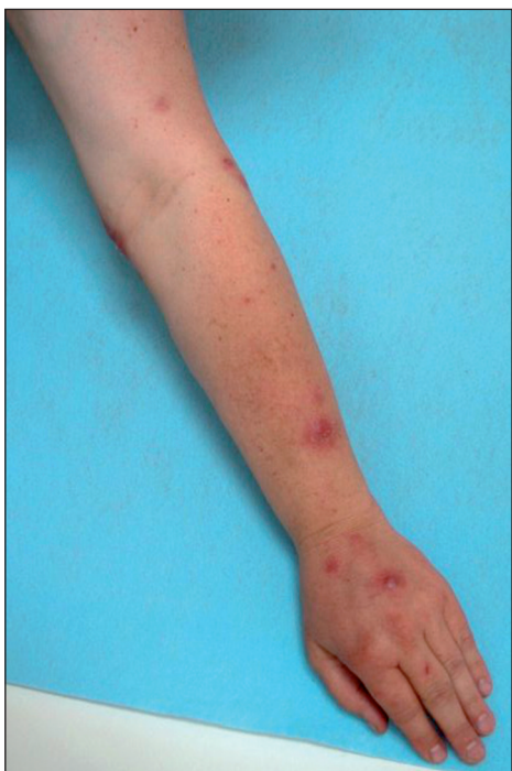
Obr. 1. Noduly na levé horní končetině.

Pacientkou je 53letá žena s nevýznamnou rodinnou anamnézou. V osobní anamnéze pacientka uváděla hypertenzi a artrózu, pro kterou jí byly provedeny úplné náhrady kyčelního a kolenního kloubu. Trvale užívá antihypertenziva. Pacientka chovala akvarijní ryby. V 12/06 čistila bez rukavic akvárium a jemně se píchla o hřbetní ploutev chovaného sumečka do špičky prostředníku levé ruky. V tomto období jí uhynulo několik ryb s kožními ulceracemi, deformací těla, vzdučným břichem a exoftalmem, což jsou vysoce suspektní příznaky při mykobakteriálním onemocnění akvarijních ryb. Za 2–3 týdny si pacientka všimla zarudnutí distálního článku poraněného prstu.