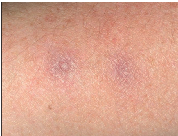
Obr. 6. Přetrvávající lividní erytémy po zhojení projevů na předloktí.

V histologickém nálezu byly patrné granulomy. Léčbu snášela pacientka velmi dobře, pravidelně byly prováděny oční kontroly a základní laboratorní vyšetření krve. Po odstranění posledního nodulu v 6/08 byla léčba ukončena.