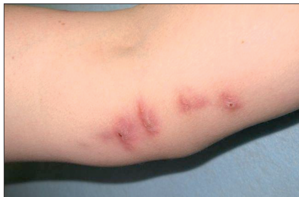
Obr. 5. Noduly bez sekrece na vnitřní oblasti lokte.

provedeno PCR pro průkaz specifických sekvencí DNA M. tuberculosis s negativním výsledkem. K dispozici nejsou dosud soupravy pro průkaz M. marinum pomocí metody PCR přímo ve tkáni. Monoterapie ciprofloxacínem měla příznivou klinickou odezvu, ale v 7/07 se objevil drobný nodulus na dorzu ruky. Proto byl podle citlivosti přidán ethambutol 2 g/den (denní dávka 25 mg/kg). Před podáním ethambutolu bylo provedeno oftalmologické vyšetření zrakové ostrosti a barvocitu. Při kombinované terapii antibiotikem a antituberkulotikem ke vzniku dalších ložisek nedocházelo. Ložiska se zmenšila a oploštila. Při kontrole v 11/07 byly všechny noduly v regresi a noduly původně secernující byly zjizvené (obr. 5). V místě primárního poranění byla hyperkeratóza, která byla jen mírně bolestivá při doteku. V 2/08 byla zfibrotizovaná lymfatická céva kratší a užší (5 cm dlouhá a 0,3 cm široká), kůže nad ní nebyla změněná. Noduly na předloktí zcela zregredovaly, zůstalo jen lividní zbarvení v úrovni kůže (obr. 6). Noduly na dorzu ruky a některé noduly v oblasti lokte přetrvávaly. Vzhledem k tomu, že pacientka byla pro artrózu indikována k další náhradě kyčelního kloubu, která bude provedena až po ukončení léčby, rozhodli jsme se pro postupnou exstirpaci přetrvávajících nodulů. Exstirpovaná tkáň byla podrobena mikrobiologickému a histologickému vyšetření. Mikroskopické vyšetření a kultivace neprokázaly přítomnost M. marinum .