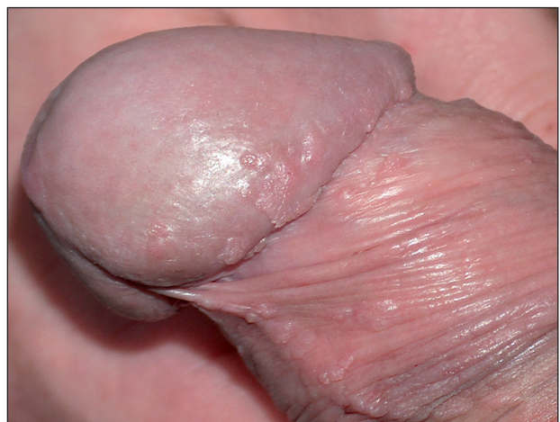
Obr. 5 Condyloma acuminatum.

álním životem pro obavu z pohlavní nemoci dostaví poprvé k lékaři. Přibližně od 30. roku věku mají projevy tendenci ke zmenšování.