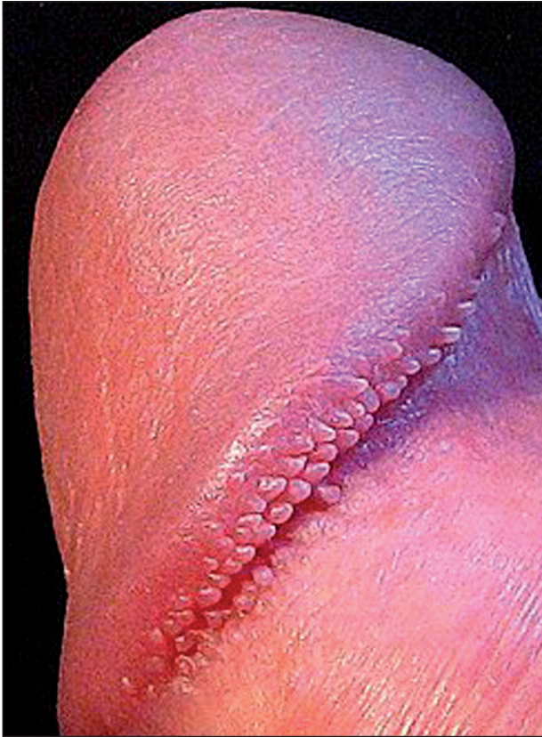
Obr. 1. Papillae coronae glandis.