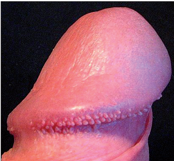
Obr. 2 Papillae coronae glandis.

zy u novorozenců dokonce i u orangutanů (4). Anglický termín „pearly penile papules“ byl zaveden, aby mylně nezavdával dojem vztahu k vlasovému folikulu (6). V současné době jsou PCG považovány za fylogenetická rezidua s histologickým obrazem akrálních angiofibromů.