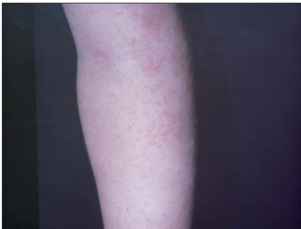
Obr. 6. Obr. 5, 6: APEC syndrom, 5-ročné dievča ( Mycoplasma pneumoniae )

strane stehna a na laterálnej strane hrudníka sa spočiatku tvoria skupiny ružových papúl s vyblednutým periférnym lemom, ďalej viac-menej ostro ohraničené ložiská ekzémového charakteru, urtikariálne, vezikulózne a purpurické ložiská postupne zasahujúce veľké plochy a nadobúdajúce anulárny charakter, v okolí s intaktnou kožou (obr. 5, 6). Lézie nezriedka svrbia.