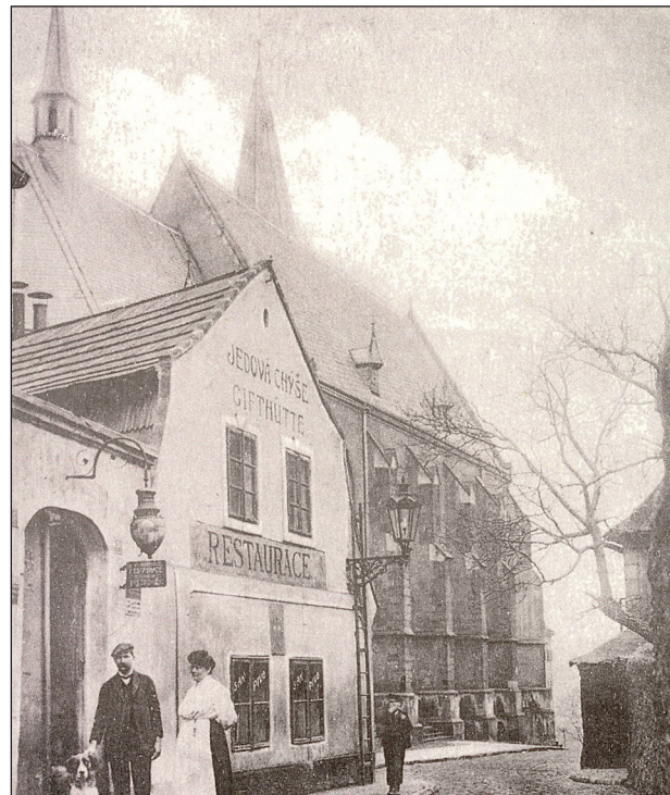
Obr. 2. Jedová chýše.

Janovský ovládal kromě češtiny a němčiny i angličtinu, francouzštinu a italštinu. Měl tak v dosahu zdroje poznání z celého kulturního světa, a ty užíval při svých výkladech studentům. V žádné klinické přednášce neslyšeli studenti citovat tolik světových lékařských autorit jako u Janovského. Nikdy se také neopomenul zmínit o „svém příteli Unnovi“. Nejlepším zrcadlem vylíčeného obrazu