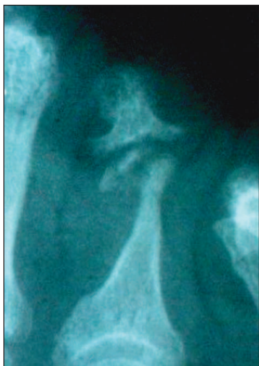
Obr. 5. Deformita „pencil in cup“ (osteolýza distální části proximální falangy a destrukce s miskovitým rozšířením proximální části distální falangy).