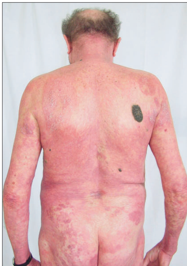
Obr. 1. Mycosis fungoides.

Imunofenotyp neoplastických buněk je nejčastěji CD3+, CD4+, CD45RO+, CD8-, vzácně se zjistí CD4-, CD8+. Častá je ztráta pan-T-antigenů. U většiny případů se najde klonální přestavba genů pro T-buněčný receptor (TCR).