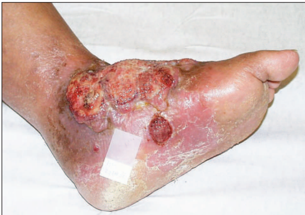
Obr. 2. Primární kožní anaplastický velkobuněčný lymfom

Lymfom se skládá z velkých buněk s anaplastickou cytomorfológií a s expresí CD30 antigenu u většiny z nich. Postihuje dospělé, 2–3krát častěji muže. Většina nemocných má solitární či lokalizované, často ulcerované tumory (obr. 2), u 20 % pacientů jsou projevy diseminované. Někdy může dojít ke spontánní regresi, ale časté jsou recidivy a v 10 % dochází k rozšíření mimo kůži.