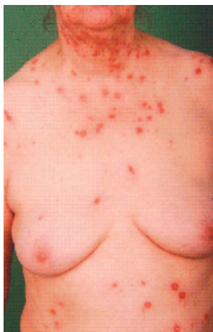
Obr. 1. Obraz erythema exsudativum multiforme při přijetí.

Po asi 10 dnech hospitalizace se opět zvýraznila zánětlivá infiltrace ložisek, na jejichž povrchu byla nyní zřetelná deskvamace. Byl odebrán materiál na mykologické