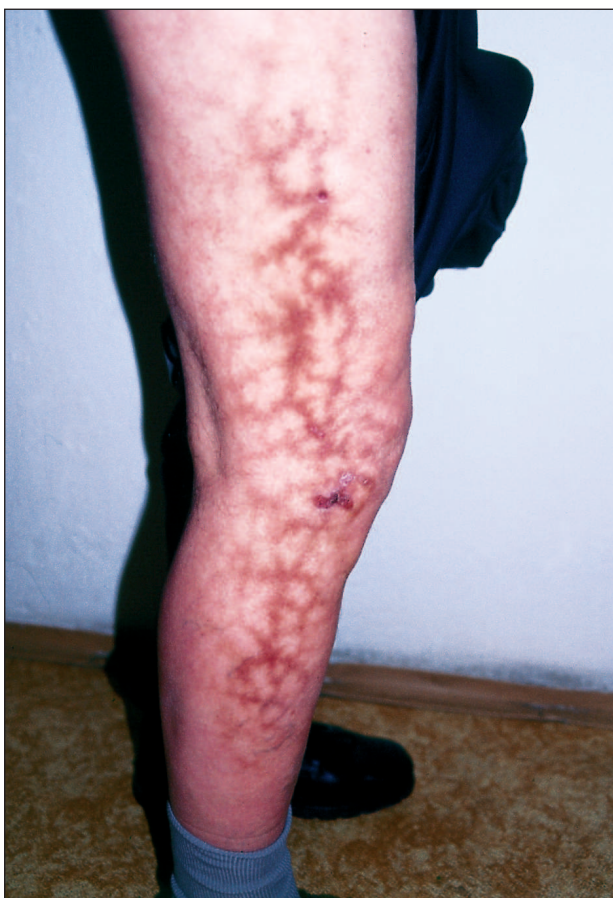
Obr. 1. Klinický obraz erythema ab igne.

66letý muž měl 1 rok progredující kožní onemocnění na zevní straně pravé dolní končetiny. Začalo podle slov pacienta „krvavým výronem“ nad zevním kotníkem a postupně se šířilo proximálně na stehno (obr. 1). Ložisko bylo souvislé, ostře ohraničené, uspořádané v pruhu 50x15 cm delší osou souběžně s končetinou. Mělo charakter hnědé nepravidelné síťovité kresby s oky sítě o průměru 1 až 2 cm. Povrch byl hladký, infiltrace nebyla přítomna. Pacient se cítil celkově zdravý, v osobní anamnéze měl jen hypertenzi léčenou Betalocem a lumboischiadický syndrom. Subjektivně bylo onemocnění provázeno svěděním a „svíravým pocitem“. Z klinického obrazu jsme soudili na livedo racemoso a provedli 2 probatorní excize z léze na stehně.