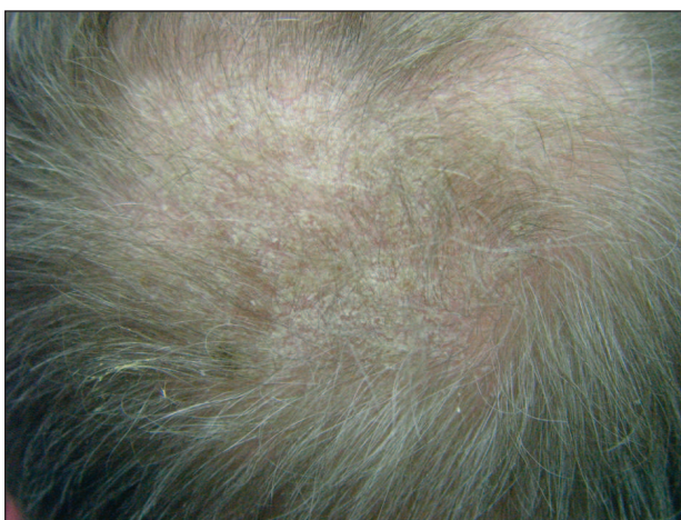
Obr. 3. DS capilitii.

Ložisková forma SD je rozvinutý stav s chronickým či recidivujícím průběhem s postižením seboroické predilekční oblasti (kštice, tvář s maximem v obočí a nazolabi-