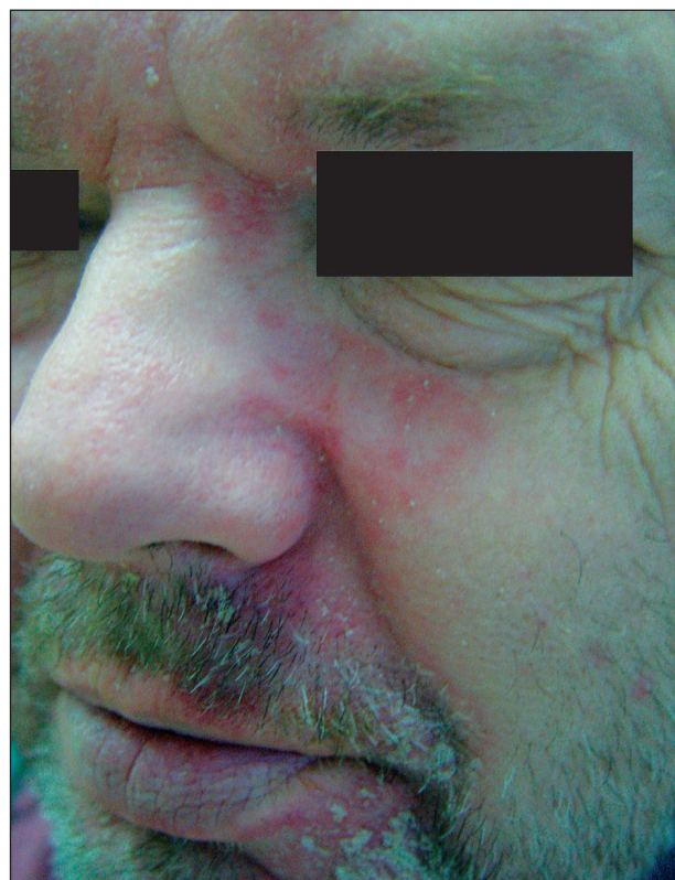
Obr. 4. DS faciei.

Dermatitis seborrhoica corporis (obr. 7) vytváří eryte-