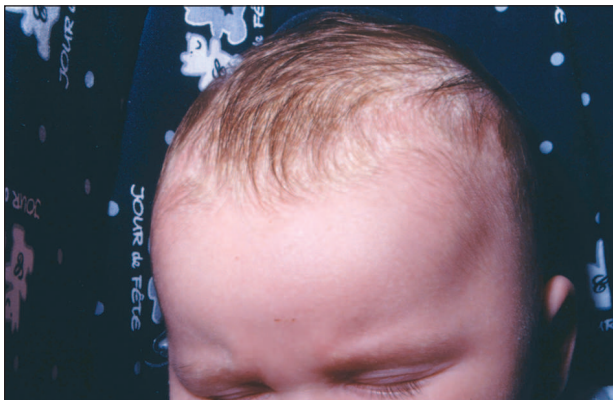
Obr. 2. Dermatitis seborrhoica (DS) infantum.

Žlutohnědé šupiny na růžové spodině, popřípadě se objevuje nad fontanelou žlutošedý nános mazlavých šupin (crusta lactea). Ze kštice se dermatitida může rozšířit do obočí a střední části obličeje, v závažnějších případech se onemocnění vyskytuje v intertriginózních lokalizacích, kde se tvoří infiltrovaná, nemokvající erytematoskvamózní ložiska. Variabilní nános mastných, žlutavých šupin bez zánětlivého erytému podmíněný nadměrnou produkcí mazu a mírnou hyperkeratózou, může zůstat jako jediný projev SD.