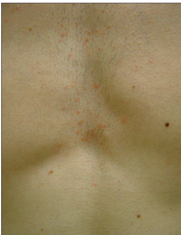
Obr. 6. DS mediothoracica.

matoskvamózní ložiska na trupu a končetinách. Dermatitis seborrhoica intertriginosa tvoří ostře ohraničené erytémy s deskvamací, s možnou přítomností ragád a sekundární infekcí.