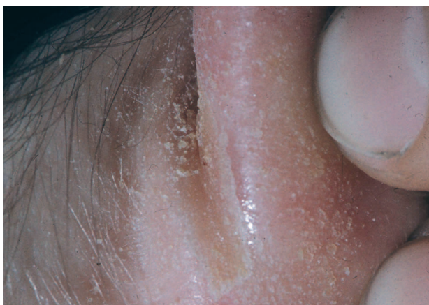
Obr. 5. DS retroauricularis.