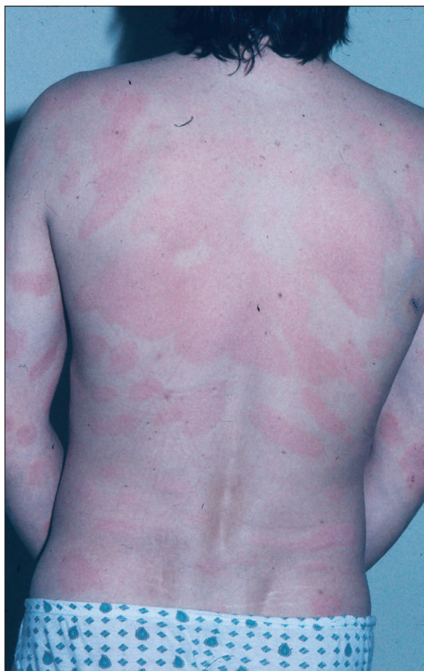
Obr. 7. DS corporis.

Blepharitis seborrhoica může být přítomna u SD jiných lokalizací, ale může být i jediným, mnohdy úporným projevem SD. Okraje očních víček nacházíme začer-